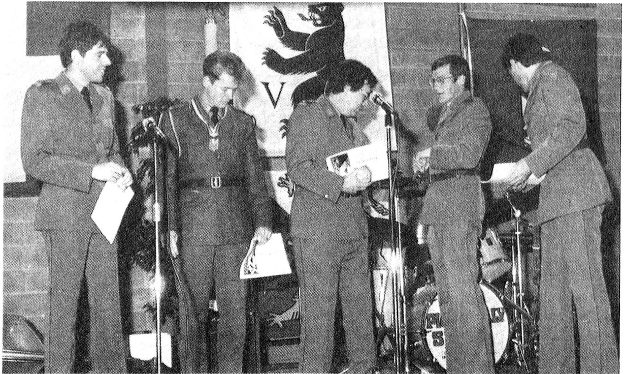
Insgesamt 17 Patrouillen beteiligten sich in der Kategorie Qm/Kom Of/KK Landwehr. Auf unserem Bild: Die drei ersten Ränge, wobei ein Teilnehmer den Fototermin verpasste.