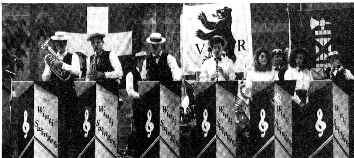
«Winti-Swingers» in voller Aktion während des abendlichen Banketts vom 27. April 1991.

Der Wetterbericht verhiess nicht unbedingt ideale Voraussetzungen. Die Föhnlage hat sich am Samstag solange wie nötig gehalten und den Wettkämpfern angenehm warmes und trockenes Klima verschafft. Als pensionierter Fourier verfügte ich nicht mehr über die notwendigen Reglemente. Es hätte auch keinen Sinn, sich mit Wissen zu belasten, das man nicht mehr benötigt. Dementsprechend unbelastet konnte unsere Patrouille das Geschehen verfolgen. Ein gros-