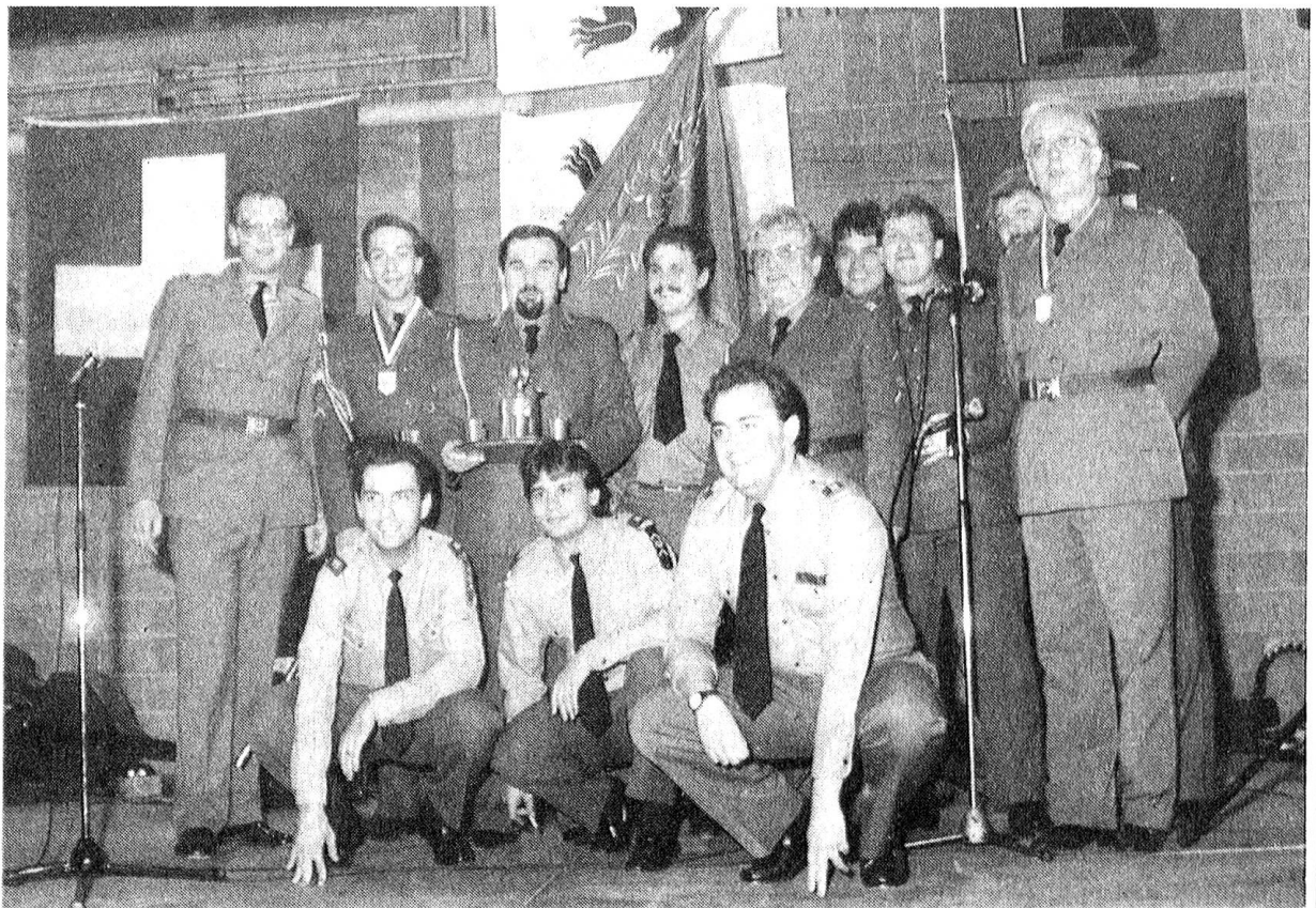
Unser Bild zeigt die Sektion Tessin (Siegerin Sektionswettkampf) mit bester Beteiligung und auch bestem Pflichtresultat. Übrigens: Die übrigen Sektionen – ausser Graubünden – wurden nicht gewertet, da die Pflichtresultate nicht erreicht wurden. Ein herzliches Dankeschön gebührt noch den Organisatoren für die einwandfreie Durchführung. Diese Wettkampftage waren einmal mehr ein Erlebnis für Aktive und Zuschauer.