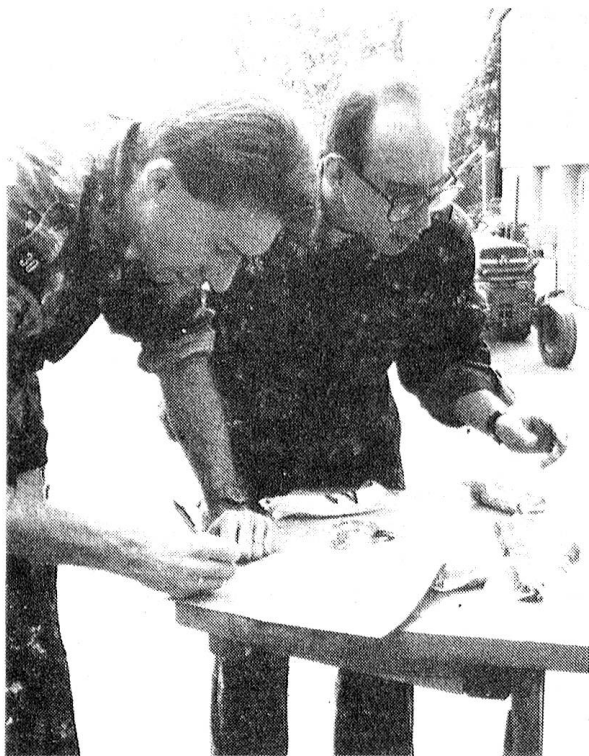
Ein Blick zum Posten Verpflegungsdienst (Warenkunde Fleisch).

ser Teil des Parcours wurde auf Naturstrassen abgewickelt. Gesteuerte oder betonierte Strecken waren dazu angetan, den Unterschied für die Knochen deutlich zu markieren. Das Schuhwerk war freigestellt. Entsprechend uneinheitlich war auch das Erscheinungsbild. Jogger waren im Vorteil, obwohl sie nicht gerade einen militärischen Eindruck erweckten. Die Zeiten ändern sich eben. Selbstredend kann ich nur über die Wettkämpfe des Fourierverbandes berichten, die ich als persönliches Erlebnis schildern kann.