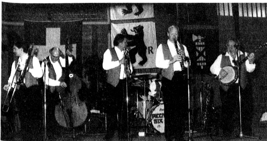
«Piccadilly Six» ein musikalisches Erlebnis. Nach dem Nachtessen und Rangverkündigung begeisterten sie jung und alt.