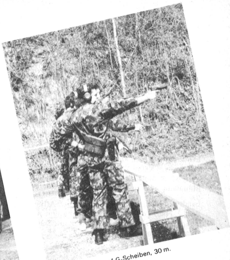
Pistolenschiessen auf G-Scheiben, 30 m.