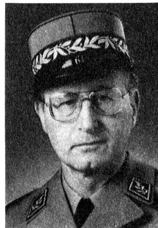
Oberkriegskommissär Brigadier Gollut

Auf Wiedersehen in Frauenfeld am 26. und 27. April 1991!