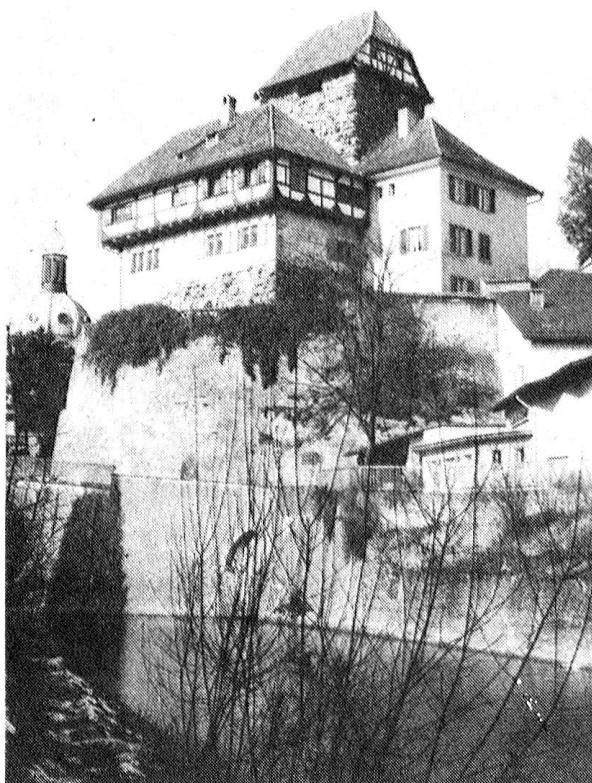
Schloss Frauenfeld, Wahrzeichen der Thurgauer Hauptstadt.

Grosse und kleine Ladengeschäfte bieten eine reiche Auswahl an Einkaufsmöglichkeiten; Gaststätten jeder Art laden zum Verweilen ein. Frauenfeld ist der thurgauische Finanzplatz; alle vier schweizerischen Grossbanken und die Thurgauische Kantonalbank sowie mehr als ein Dutzend Versicherungsgesellschaften haben ihre Niederlassungen bei uns.