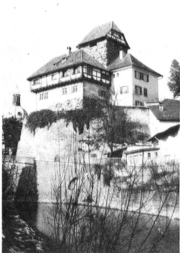
Schloss Frauenfeld, Wahrzeichen der Thurgauer Hauptstadt.

Grosse und kleine Ladengeschäfte bieten eine reiche Auswahl an Einkaufsmöglichkeiten; Gaststätten jeder Art laden zum Verweilen ein. Frauenfeld ist der thurgauische Finanzplatz; alle vier schweizerischen Grossbanken und die Thurgauische Kantonalbank sowie mehr als ein Dutzend Versicherungsgesellschaften haben ihre Niederlassungen bei uns.