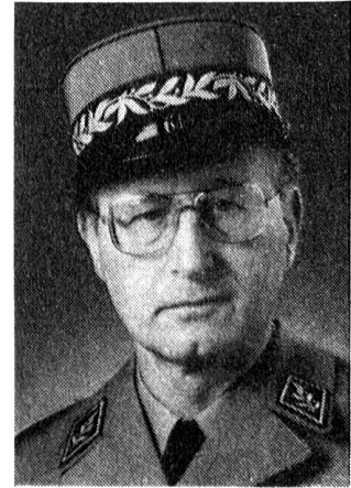
Oberkriegskommissär Brigadier Gollut

Auf Wiedersehen in Frauenfeld am 26. und 27. April 1991!