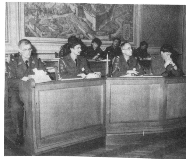
Die Zentraltechnische Kommission an der DV