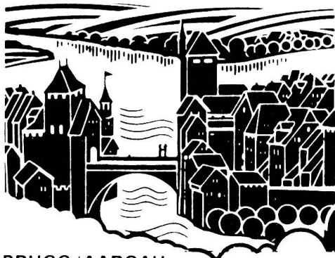
BRUGG / AARGAU