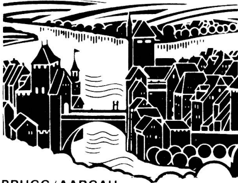
BRUGG / AARGAU

Sehr geehrte Gäste Geschätzte Offiziere Liebe Kameradinnen und Kameraden