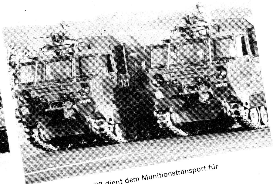
Der Raupenpanzer 68 dient dem Munitionstransport für die Panzerartillerie.