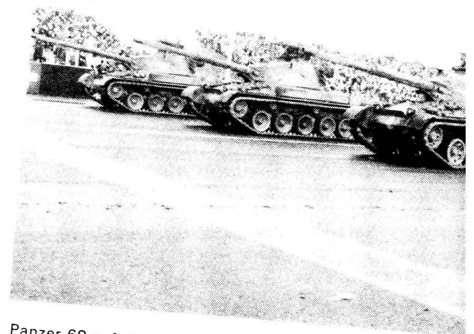
Panzer 68 auf der Defilierstrecke in Dübendorf.

Militärattachées aus aller Welt wollen sich über die Stärke unserer Armee informieren.