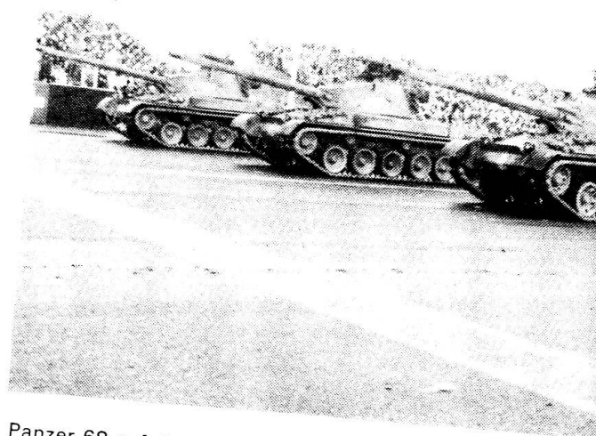
Panzer 68 auf der Defilierstrecke in Dübendorf.

Militärattachées aus aller Welt wollen sich über die Stärke unserer Armee informieren.