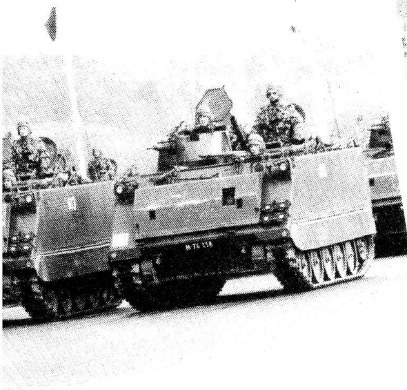
nören zum Erscheinungsbild eines Pz Bat.

«Dreizack» ist tot, es lebe die nächste GVU . . . Wir sind sicher, dass die letzten Tage und Wochen unter dem Stichwort «Weisch no?» noch lange zu reden geben werden. Und bekanntlich ist in der Erinnerung alles gleich doppelt so spannend, strapaziös, gefährlich, unglaublich. Deshalb wird «Dreizack» wohl als das Manöver in die Geschichte eingehen.