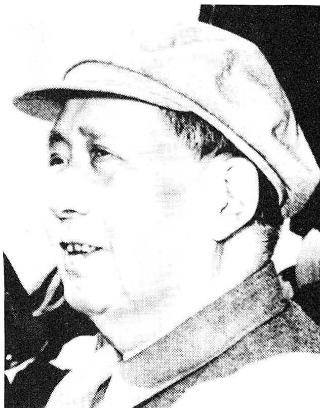
Mao Tse Tung Gründer der Kommunistischen Partei Chinas und Führer der Roten Armee.

Als nach 8jähriger Dauer des Verteidigungskriegs im Jahr 1945 der Sieg über Japan erkämpft worden war, lebten die alten politischen Gegensätze wieder auf und von 1946 hinweg wuchsen sich die Auseinandersetzungen zwischen den beiden chinesischen Parteien zu einem neuen Bürgerkrieg aus, der als der dritte revolutionäre Bürgerkrieg (1945 – 1950 bezeichnet wird. In diesen Kämpfen erhielt die Rote Armee, die sich seit 1946 «Chinesische Volksbefreiungs-Armee»