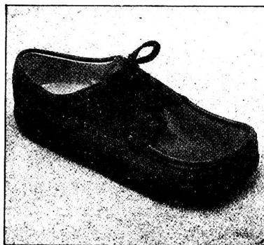
Modell 353 «Rustikal» in den Farben natur, dunkelbraun, marineblau und schwarz.

Ihre Zehen haben Platz, Ihr Fuss hat festen Halt. Sie laufen bequem und sicher. Nichts drückt, nichts schmerzt. Sie vergessen fast, dass Sie Schuhe tragen. Es ist wie Barfussgehen. Trotz der anatomisch richtigen fussgerechten Form sind 'jacoform' Bequem-Schuhe sportlich-chic.