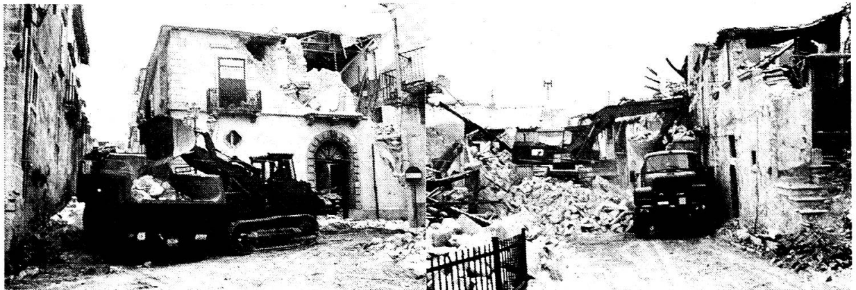
Bilder vom Erdbebengebiet Italien

Einen Sonderfall des Einsatzes von Militärpersonen zu nicht militärischen Zwecken lag in der Tätigkeit von Angehörigen der Luftschutz- und Genietruppen als Verstärkung des schweizerischen Katastrophenhilfskorps im südtalienenischen Erdbebengebiet . Der Einsatz erfolgte freiwillig und ohne Anrechnung auf die Dienstpflicht in der Armee.