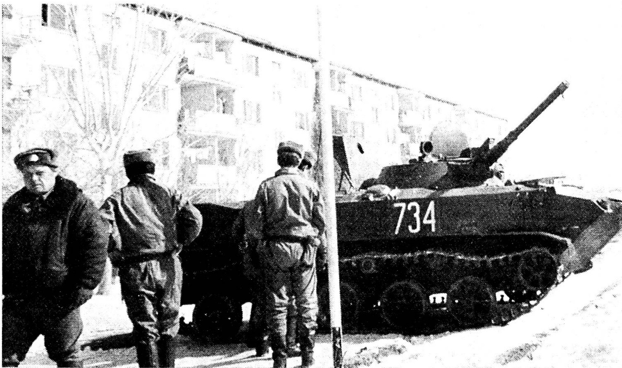
Panzer vor Wohnblock in Kabul / Afghanistan

1. Eindrücklicher als alle mahnenden Worte hat im vergangenen Jahr die Entwicklung der internationalen Lage die Notwendigkeit einer dauernden und vollen Wehrbereitschaft deutlich gemacht. Das Jahr begann mit dem Donnerschlag der sowjetischen Invasion in Afghanistan, dessen gefährliche Besonderheit darin bestand, dass es sich bei diesem Feldzug gegen einen ausserhalb des östlichen Militärbündnisses stehenden Staat nicht mehr wie bisher um einen «Stellvertreterkrieg» handelte, da die Sowjetunion mit ihren eigenen Kräften den Angriff gegen Afghanistan führte. Neben dem