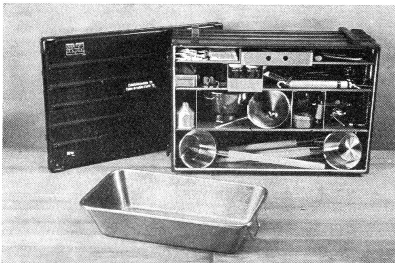
Neue Einheitsküchenkiste wird durchwegs begrüsst

Ich bin natürlich über diesen Entscheid sehr enttäuscht, besonders, weil ich mich für die Wegwerfmützen im WK eingesetzt habe. Trotz positivem Verlauf der Versuche scheidet nun eine Beschaffung am finanziellen Aufwand (Oberstlt P. Creux, Zentralpräsident der Schweizerischen Offiziersgesellschaft der Versorgungstruppen). Ich kann nur hoffen, dass sich die Lage unserer Bundesfinanzen rasch verbessert und in absehbarer Zeit unser Begehren, eine hygienische Kopfbedeckung für das Küchenpersonal zu beschaffen, verwirklicht werden kann. In der Zwischenzeit werden wir uns mit «ad-hoc» Lösungen begnügen müssen.