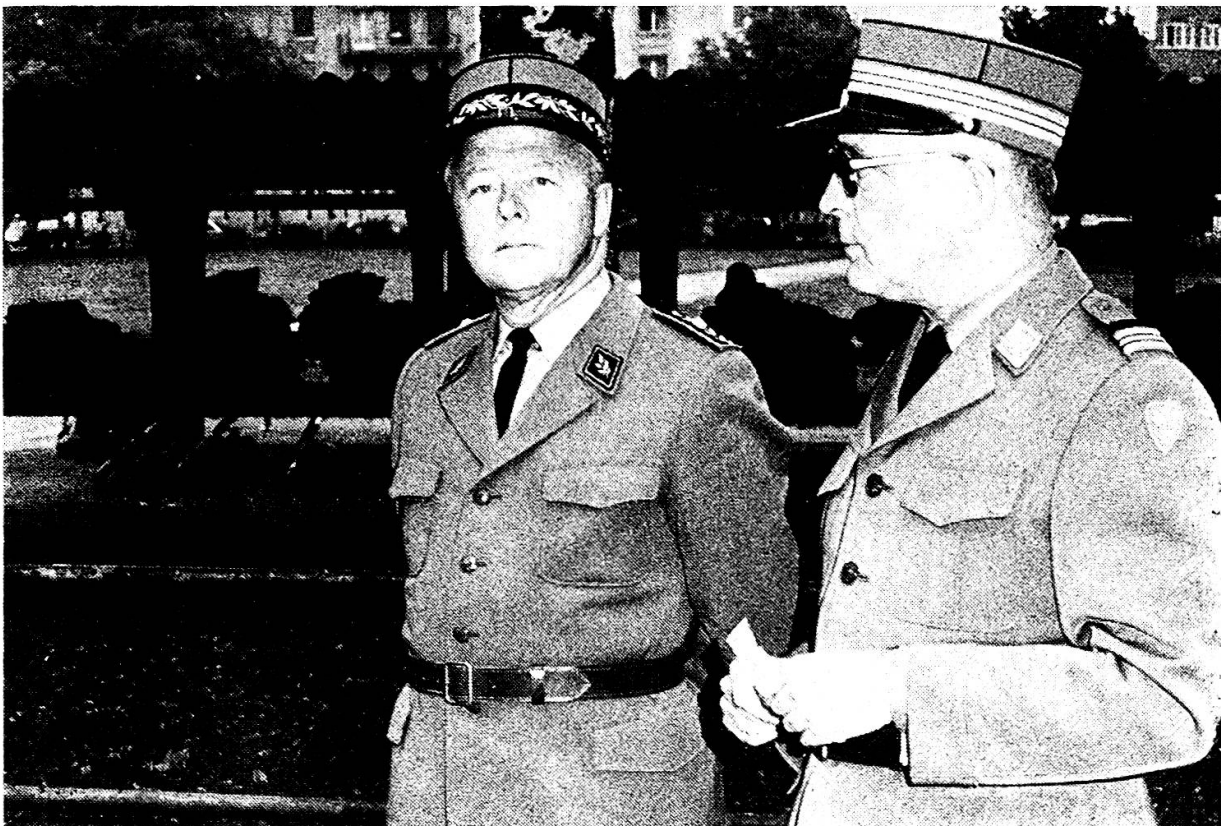
Brigadier Ehsam und Oberst Kesselring freuen sich an der guten Haltung der Aspiranten beim Einmarsch in die Kaserne.

am Bielersee, über den spiegelblanken See leuchten die Lichter von La Neuveville herüber, ein Tuten verkündet die Ankunft des letzten Kursschiffes. Plötzlich ein nicht enden wollendes Trampeln über den dröhnenden Dampfschiffsteg, und durchs Dunkel der Herbstnacht huschen die Aspiranten in Kampfanzug mit Sturmgewehr. Am Ufer suchen sie sofort Deckung hinter den gepflegten Büschen des Parks.