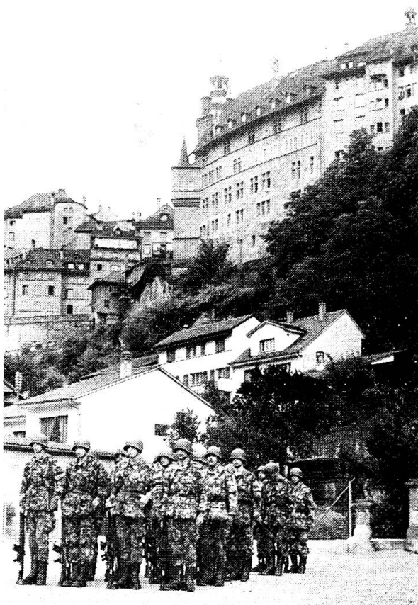
Historische Umgebung prägt!