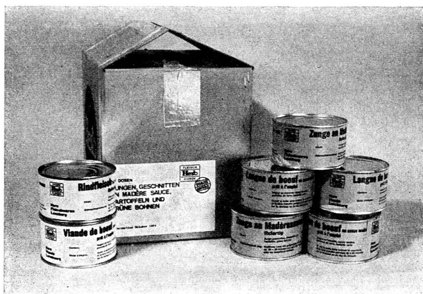
Sehr beliebt sind auch Fertigmahlzeiten

Die Tonbildschau soll zeigen, dass das OKK bemüht ist, dem Wehrmann in jeder Situation eine zweckmässige und abwechslungsreiche Verpflegung zu gewährleisten.