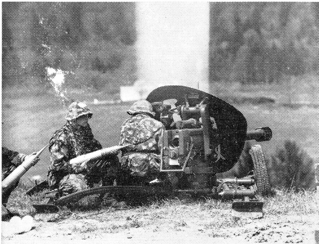
Die 9-cm-Panzerabwehrkanone 57