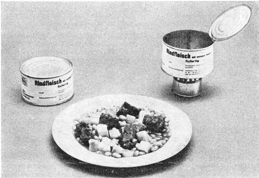
Art. Nr. 315 Rindsragout, Kartoffeln und weisse Bohnen