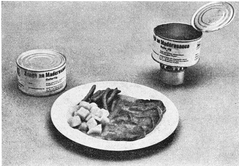
Art. Nr. 314 Zunge, Kartoffeln und grüne Bohnen