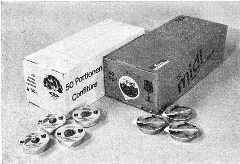
Art. Nr. 46 Konfitüre in Portionen. Cartons zu 50 Portionen zu 50 g