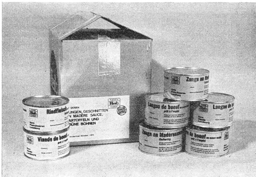
in Cartons zu 24 Dosen