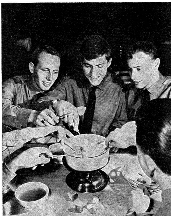
Fondue isch guet und git e gueti Truppemoral!

Der Dank für die Abwechslung: fröhliche Gesichter und natürlich eine ausgezeichnete Truppenmoral!