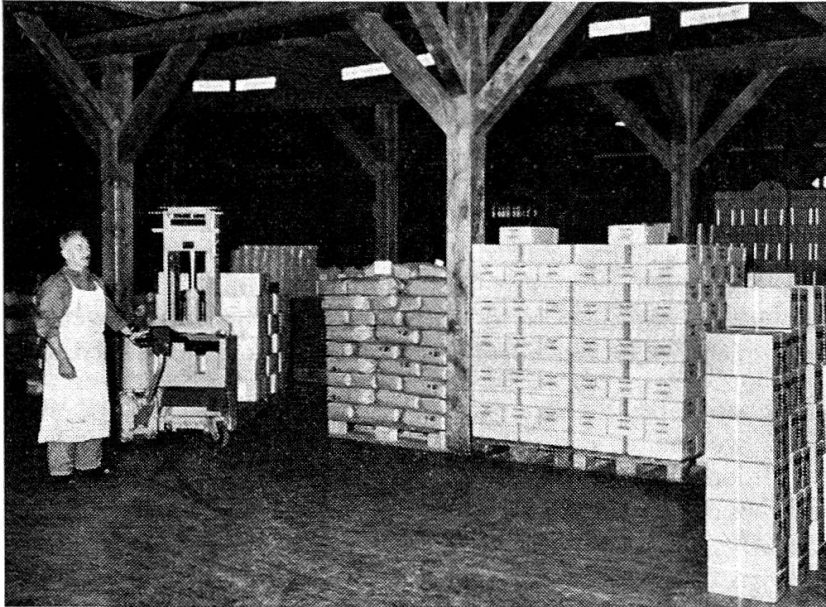
In einem Armee-Verpflegungsmagazin