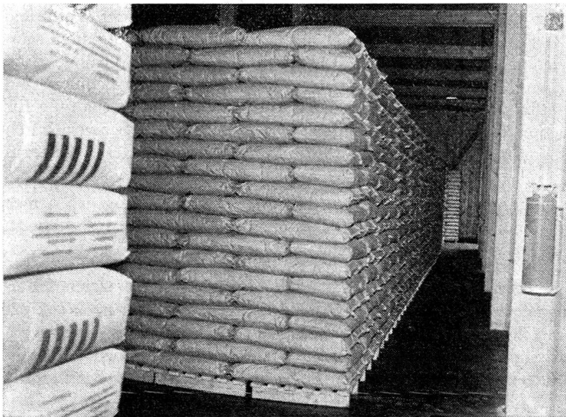
Ware mit wenig Lager- bewegung wird aus Platz- gründen mehrere Schichten hoch nicht auf Paletten, sondern auf Rosten gelagert.