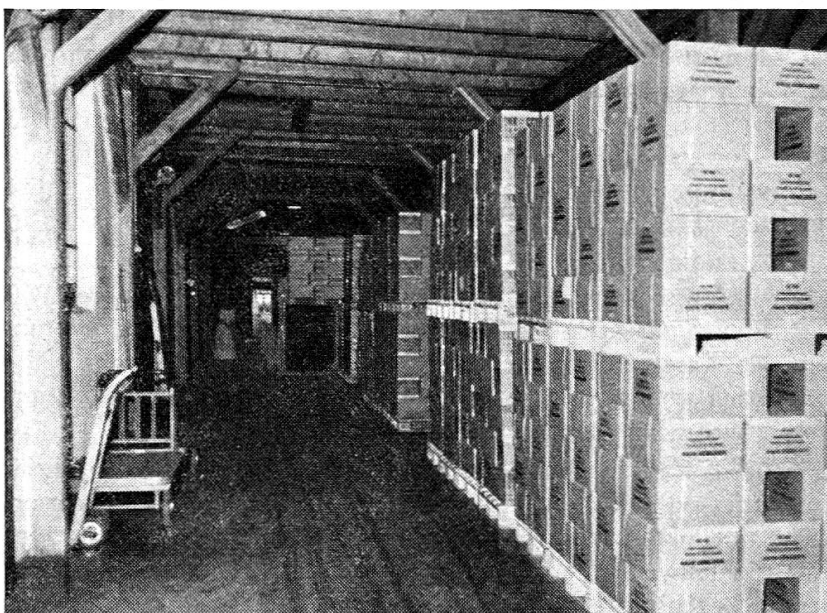
Lagerung mittels Paletten