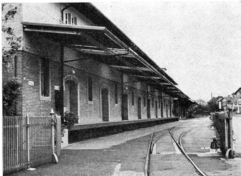
Armee-Verpflegungsmagazin mit Geleiseanschluss

Bei strikter Beachtung dieser Punkte kann die Arbeit der Armee-Verpflegungsmagazine erheblich erleichtert werden.