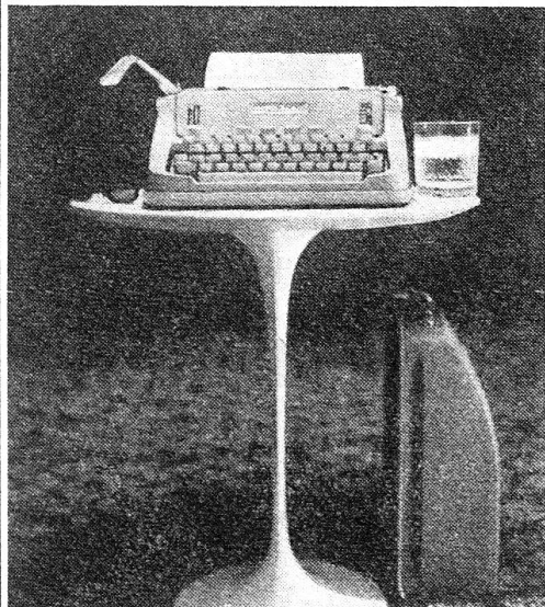
HERMES Hermes 3000 Fr.560.- Hermes-Media 3 Fr.395.- Hermes-Baby Fr.248.-