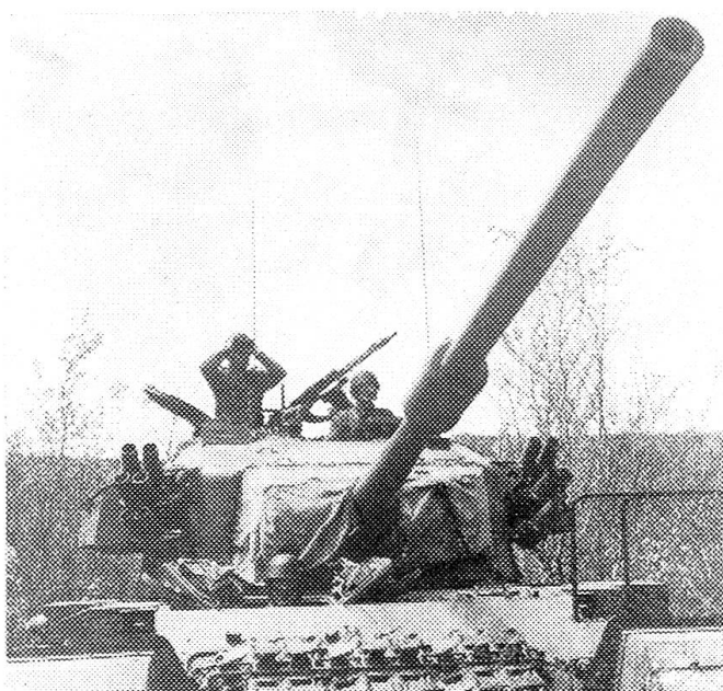
Der Kampfpanzer Centurion mit seinem 10,5 cm Geschütz ist für das Duell selbst mit stärksten Feindpanzern geeignet. Noch stellen seine verschiedenen Abarten den Haupttharst unserer Panzer in den mechanisierten Divisionen.