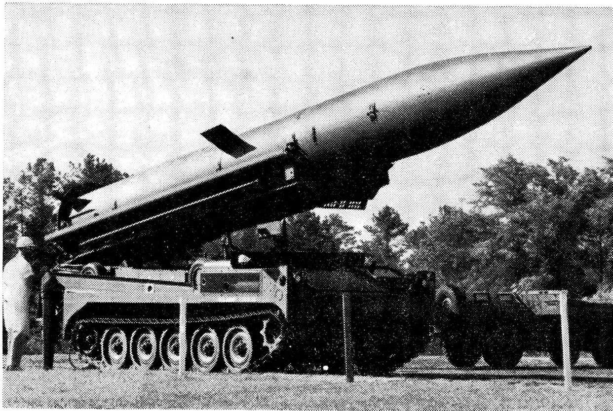
Das Bild zeigt ein Trägerfahrzeug der neuen amerikanischen Lenkwaffe PERSHING mit aufgesetzter Transport-, Aufrichte- und Abschussvorrichtung. Es ist mit einem Chrysler-Motor versehen und hat bei einer Geschwindigkeit von 64 km/Std. einen Aktionsradius von 320 km.