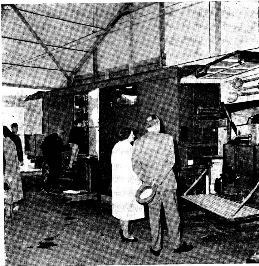
Ein Ausschnitt aus der Ausstellung