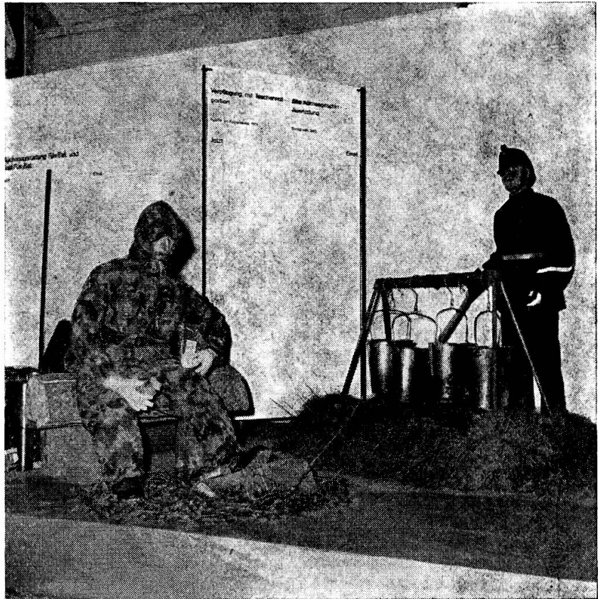
Rechts: Alte Küchengerät- ausrüstung, Soldat von 1885