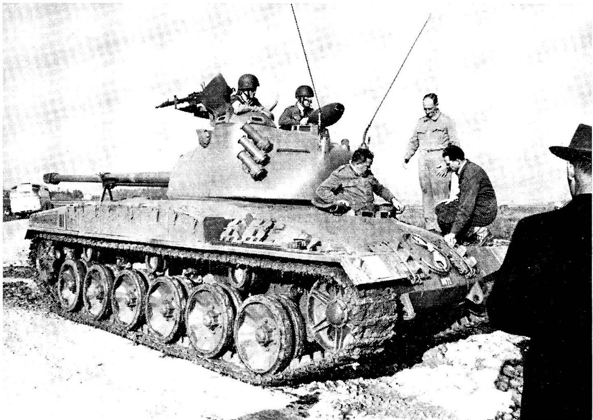
Bundesrat Chaudet als Panzerfahrer. Der Chef des EMD hat sich in Thun selbst von den guten Eigenschaften des Pz. 58 überzeugt, um sich bei einer Fahrprobe auch über die guten Lenk- und Fahreigenschaften zu vergewissern.

Diese Leistung, das hat die Vorführung auf der Thuner Allmend unter Beweis gestellt, hat diese optimistische Feststellung in allen Teilen erfüllt. Die Demonstration hinterliess bei der Presse und bei den Fachleuten einen sehr positiven und überzeugenden Eindruck. Die Eigenentwicklung von Kampffahrzeugen wurde schon während des letzten Krieges eingeleitet, als die Schwierigkeiten, aus dem Ausland geeignete Fahrzeuge zu beschaffen, offensichtlich waren. Es sind damals der NK 1 und der NK 2 begonnen worden; diese Entwicklung ist aber nie über das Stadium von Prototypen hinausgelangt. Inzwischen war es dann möglich, nach dem letzten Krieg aus der Tschechoslowakei den heute noch verwendeten Panzerjäger G 13, in Frankreich den AMX-Panzerjäger und von den Engländern den Centurion zu kaufen.