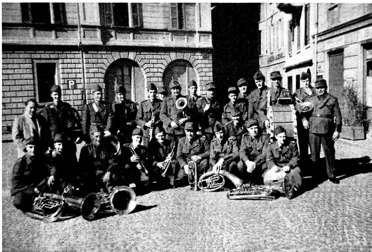
Musica Militare Ticinese. Diamo una fotografia ritratta in occasione della Staffetta del Gesero a Bellinzona il 22 febbraio u.s., ossia il primo concerto e prestazione. Nel prossimo numero pubblicheremo i nomi degli aderenti.

Arrivederci a Soletta il 5, 6 e 7 giugno. I ritardatari annunciarsi subito.