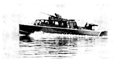
Patrouillenfahrt bei Nebel.

Schon beim ersten Feinkontakt hat der Kommandant das Wichtigste seines Auftrages nicht vergessen: laufende Meldungen über Stärke, Standort und Bewegungsrichtung des Gegners an die Grenztruppen durchzugeben. Diese können dadurch vom See her nicht mehr überrascht werden und rechtzeitig ihre Gegenmassnahmen treffen. Damit ist diese Phase der Übung beendet, weitere werden durchgespielt bis zum Tagesanbruch.