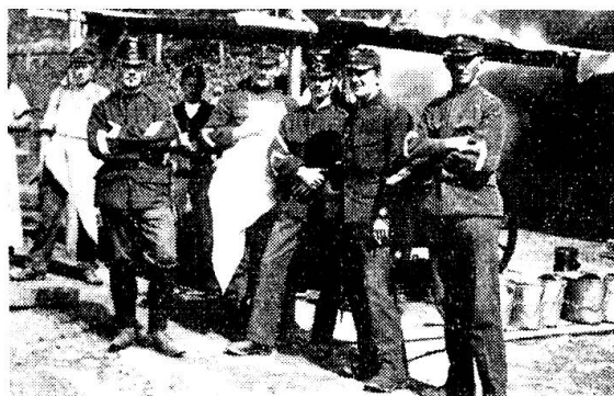
Eine Küchenmannschaft aus den ersten Jahren der Grenzbesetzung 1914/18.

von 15 auf 20 g erhöht. Statt des frischen Fleisches empfahl es nebst den schon im Entwurf von 1875 figurierenden Ersatzmitteln 275 g gesalzenes Fleisch oder Büchsenfleisch.