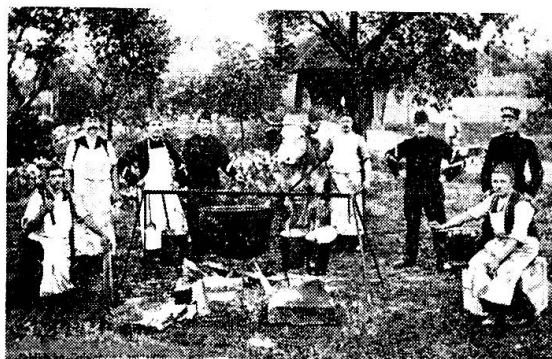
Eine Manövererinnerung aus dem Jahre 1913. Die Kp.-Küche im Felde.

1886 legte die Sektion des 7. Divisionskreises des Schweizerischen Verwaltungsoffiziersvereins ein Gesuch zuhanden des Eidgenössischen Militärdepartementes vor, es seien auch die Fuss-truppen mit Fahrküchen auszurüsten. Hptm. Liehti, Bern, Redaktor der «Blätter für Kriegsverwaltung» opponierte diesem Antrag, weil er eine Vermehrung der Trains bedeute und weil ein solches Begehren Sache der Infanterie und nicht der Verwaltungsoffiziere sei. Ebenso äusserte sich der Oberkriegskommissär ablehnend und die Eingabe wurde verworfen.