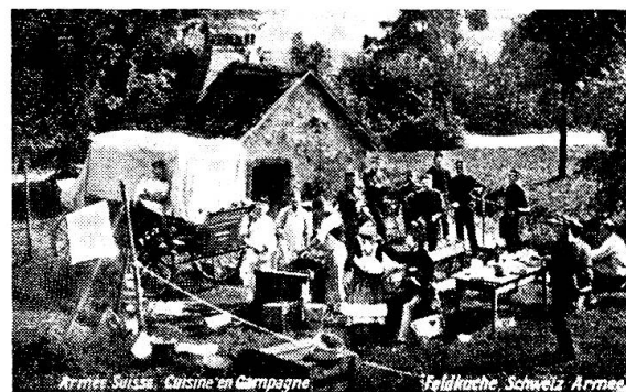
Eine Feldküche der Schweizer Armee aus den Jahren vor dem Ersten Weltkrieg.