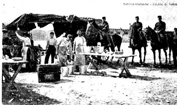
Dieses Bild zeigt die Feldküche der Batterie 41 in der Zeit vor dem Ersten Weltkrieg.

Die erste Rekrutenschule für Verwaltungstruppen, derjenigen Mannschaft, ohne welche selbst die stolze der Waffengattungen unter Umständen nicht leben könnte, fand vom 28. August bis 18. Oktober 1875 in Thun statt. Im ganzen waren 93 Rekruten eingerückt (der Kanton Tessin hatte in völliger Unkenntnis der Aufgabe der Verwaltungstruppen einen Tapezierer gesandt, der mit 18 ärztlichen Entlassenen den Laufpass erhielt). Zuerst wurden aus den Leuten Soldaten geschaffen; dann kam die technische Instruktion: Errichtung einer Bäckerei und Schlächterei. Pro Sektion erstellte man einen Backofen, also im ganzen vier. Unter Fernhaltung von Zivilpersonen traten die Bäcker in Aktion und buken täglich ca. 1000 Portionen Brot (120—130 pro Schuss). In der Schlächterei verblutete täglich ein Ochse, und so war es möglich, die ganze Besatzung der Kaserne von 1000 Mann während 7 Tagen vollständig mit Fleisch und Brot zu versehen. Ein Ausmarsch kurz vor