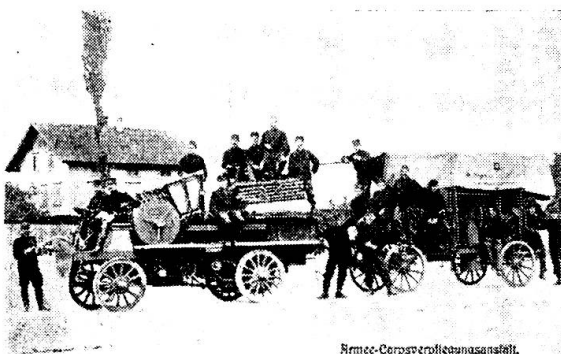
Diesen Aufzug nannte man um das Jahr 1910 herum eine «Armee-Corps-Verpflegungsanstalt».

Die erste Rekrutenschule für Verwaltungstruppen, derjenigen Mannschaft, ohne welche selbst die stolze der Waffengattungen unter Umständen nicht leben könnte, fand vom 28. August bis 18. Oktober 1875 in Thun statt. Im ganzen waren 93 Rekruten eingerückt (der Kanton Tessin hatte in völliger Unkenntnis der Aufgabe der Verwaltungstruppen einen Tapezierer gesandt, der mit 18 ärztlichen Entlassenen den Laufpass erhielt). Zuerst wurden aus den Leuten Soldaten geschaffen; dann kam die technische Instruktion: Errichtung einer Bäckerei und Schlächterei. Pro Sektion erstellte man einen Backofen, also im ganzen vier. Unter Fernhaltung von Zivilpersonen traten die Bäcker in Aktion und buken täglich ca. 1000 Portionen Brot (120—130 pro Schuss). In der Schlächterei verblutete täglich ein Ochse, und so war es möglich, die ganze Besatzung der Kaserne von 1000 Mann während 7 Tagen vollständig mit Fleisch und Brot zu versehen. Ein Ausmarsch kurz vor