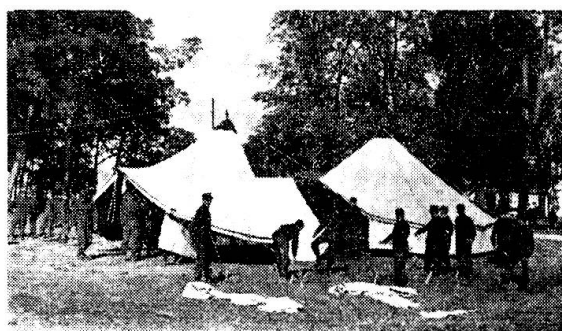
Verpflegungsgruppen. Aufstellen der Bäckerzelte. Troupes des boulangeries. Montage de tentes de boulangerie.

Schluss des Dienstes erprobte die Zweckmässigkeit einer Fahrküche. Als Übelstand erwies sich das Fehlen einer Schusswaffe, die doch im Interesse der Erziehung und der Disziplin liegen