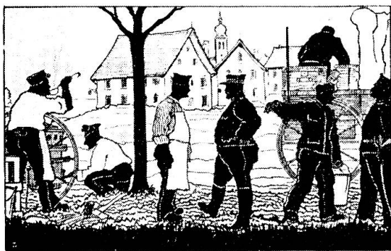
Soldatenkarte aus der Grenzbesetzung 1914/18, eine Kp.-Küche im Jura zeigend.