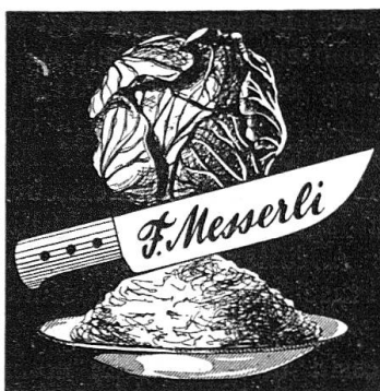
bürgt für gutes Sauerkraut

Gemäß Beschluß der Vorstandssitzung vom 25. September 1949 findet die Generalversammlung der PSS mit anschließendem Absenden Samstag, den 28. Januar 1950 im Rest. „Unteres Albisgütli“ statt. Gleichzeitig wurde beschlossen, das 25-jährige Bestehen der PSS mit einem Freundschaftsschießen und einem einfachen Jubiläumsakt zu begehen. Dieser Anlaß findet am 6./7. Mai 1950 statt. Wir bitten alle Kameraden, diese beiden Daten heute schon in ihrem Kalender 1950 zu vermerken.