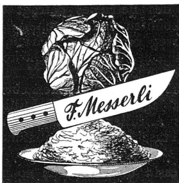
bürgt für gutes Sauerkraut

Gemäß Beschluß der Vorstandssitzung vom 25. September 1949 findet die Generalversammlung der PSS mit anschließendem Absenden Samstag, den 28. Januar 1950 im Rest. „Unteres Albisgütli“ statt. Gleichzeitig wurde beschlossen, das 25-jährige Bestehen der PSS mit einem Freundschaftsschießen und einem einfachen Jubiläumsakt zu begehen. Dieser Anlaß findet am 6./7. Mai 1950 statt. Wir bitten alle Kameraden, diese beiden Daten heute schon in ihrem Kalender 1950 zu vermerken.