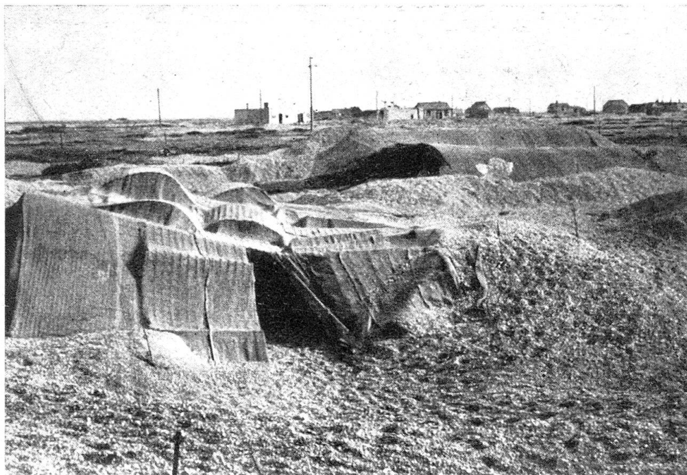
Getarntes Treibstofflager an der Südküste Englands

6. Einige Wochen nach dem „D Day“ trat die Gruppe PLUTO in Aktion. Nachdem die Halbinsel von Cherbourg mehr oder weniger von Minen gesäubert war, konnten nun verschiedene Leitungen gelegt werden. Das R. A. S. C. lieferte Treibstoff nach der Normandie. Kurz nach der Öffnung des Hafens von Cherbourg verlor die Leitung Sandown, Isle of Wight, an Bedeutung. Neue PLUTO wurden gelegt, um die nach Holland und Belgien vorstoßenden Alliierten zu versorgen. Dadurch wurde vermieden, daß diese Kräfte auf den Nachschub von Cherbourg und den „Mulberry Harbours“ angewiesen waren.