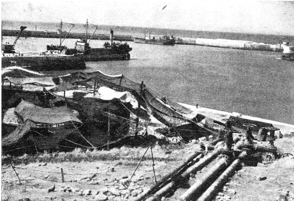
Hafen von „Yapton“. Endstation einer «PLUTO»