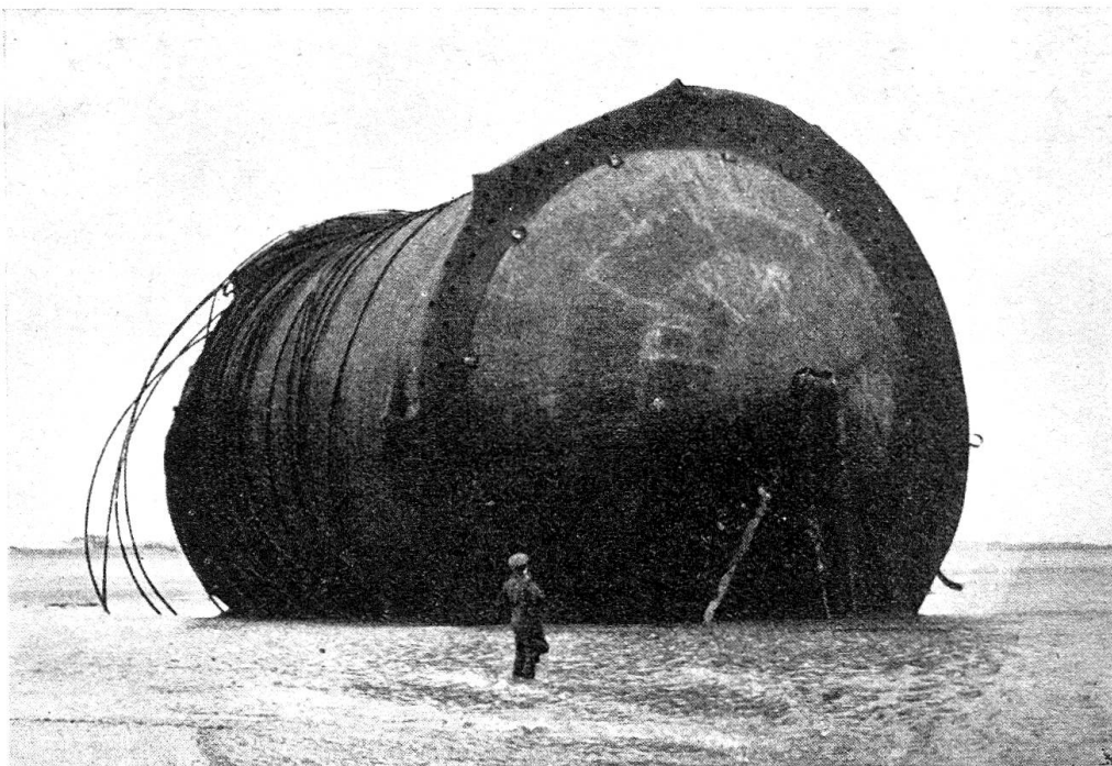
Bild eines «H. M. S. CONUNDRUMS» genannt «CONUNS»

5. Nun wurde unter dem Kommando des Capt. J. F. Hutchings, C.B.E., D.S.O., Royal Navy, die Operationsgruppe „PLUTO“ gebildet. Dieser Einheit waren Schiffe in allen Größen, vom Motorboot bis zum 10 000 Tonnen-Dampfer zugeteilt. Die Besatzung setzte sich aus Beständen der Handelsmarine zusammen und wurde durch Admiral Sir Bertram Ramsay (Kdt. der alliierten Marine, Expeditionskorps, Invasions Streitkräfte) befehligt. Die Gruppe zählte 100 Of. und 1000 Uof. und Soldaten, mit Hauptstandort in Southampton und Tilbury.