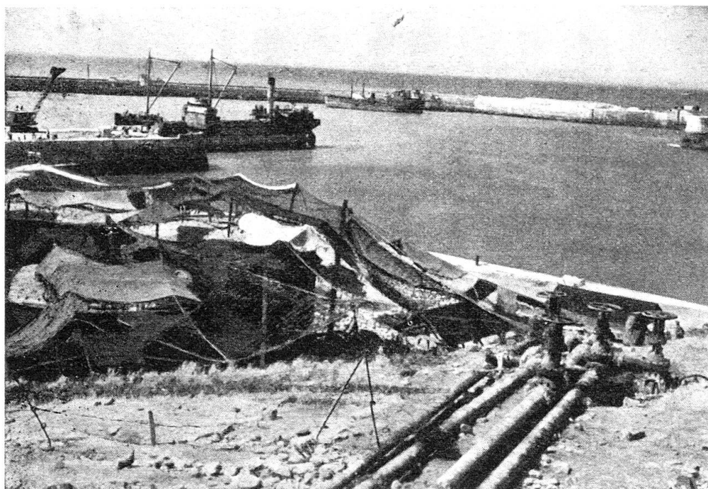
Hafen von „Yapton“. Endstation einer «PLUTO»