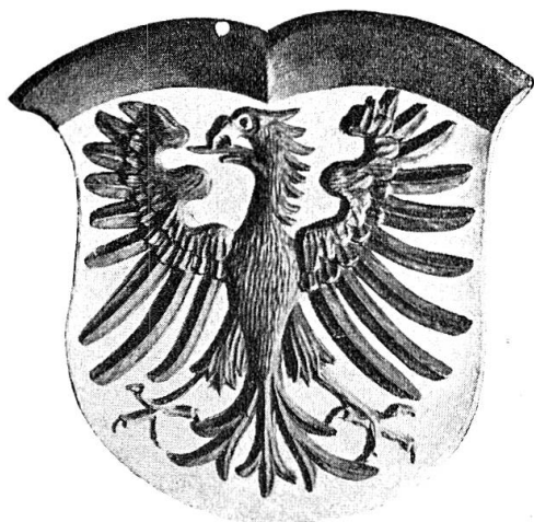
Stadtwappen Aarau von 1520

Die Juni-Nummer erscheint infolge der IX. Schweiz. Fouriertage bereits am 10. Juni 1946. Redaktionsschluss: 28. Mai 1946.