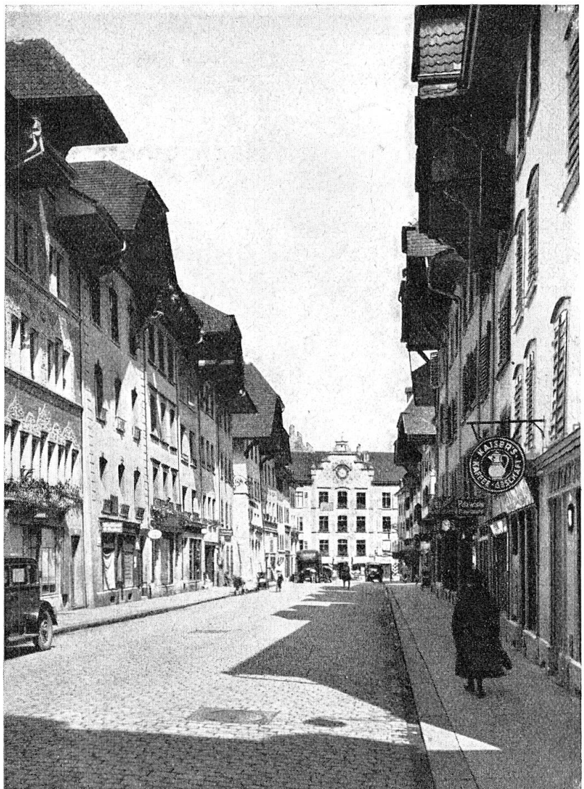
Rathausgasse von Süden

20.30 Jubiläumsfeier und Abendunterhaltung mit Ball im Saalbau.