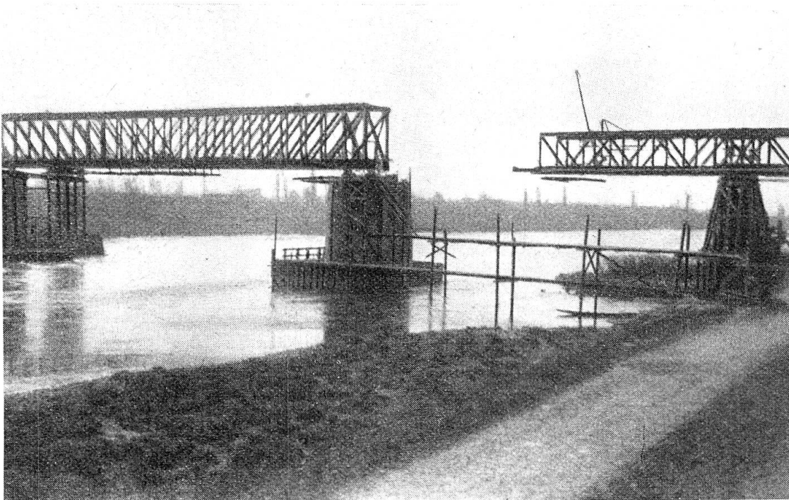
Wiederaufbau der Brücke von Chalampé

Mauern, fehlende Fensterscheiben, die durch Pergamentpapier ersetzt sind und da der erste Tank an der Strasse, kurz vor Kembs. Beim Kraftwerk Kembs steigen wir aus. Die gewaltigen Zerstörungen zeigen sich erst bei näherem Zusehen. Während die Mauern des Gebäudes nicht gelitten haben, zerstörten die Deutschen vor ihrem Rückzug das Innere vandalisch, zum Teil mit Flammenwerfern. Zerrissene Leitungskabel, vom Rost zerfressene Maschinenteile und da, das erste Kriegergrab eines jungen Deutschen. Direkt beim Gebäude ein kleiner Grabhügel, verdorrte Blumen in einer Blechbüchse, ein einfaches Holz-