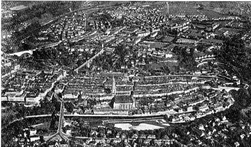
Blick über die Stadt.

Land und hinan zu den ewigen Bergen zu schauen. Vielleicht aber, dass es auch Gäste gibt, die sich gerne von erfahrenen Berner Kameraden zu den stillen Kellern der Stadt geleiten lassen, um dort freundlicher Kühlung und trefflichen Trankes teilhaftig zu sein und es wäre nicht verwunderlich, wenn zuzeiten aus fröhlichen Tiefen ein Lied heraufklänge in den lärmenden Trubel einer festfrohen Stadt.