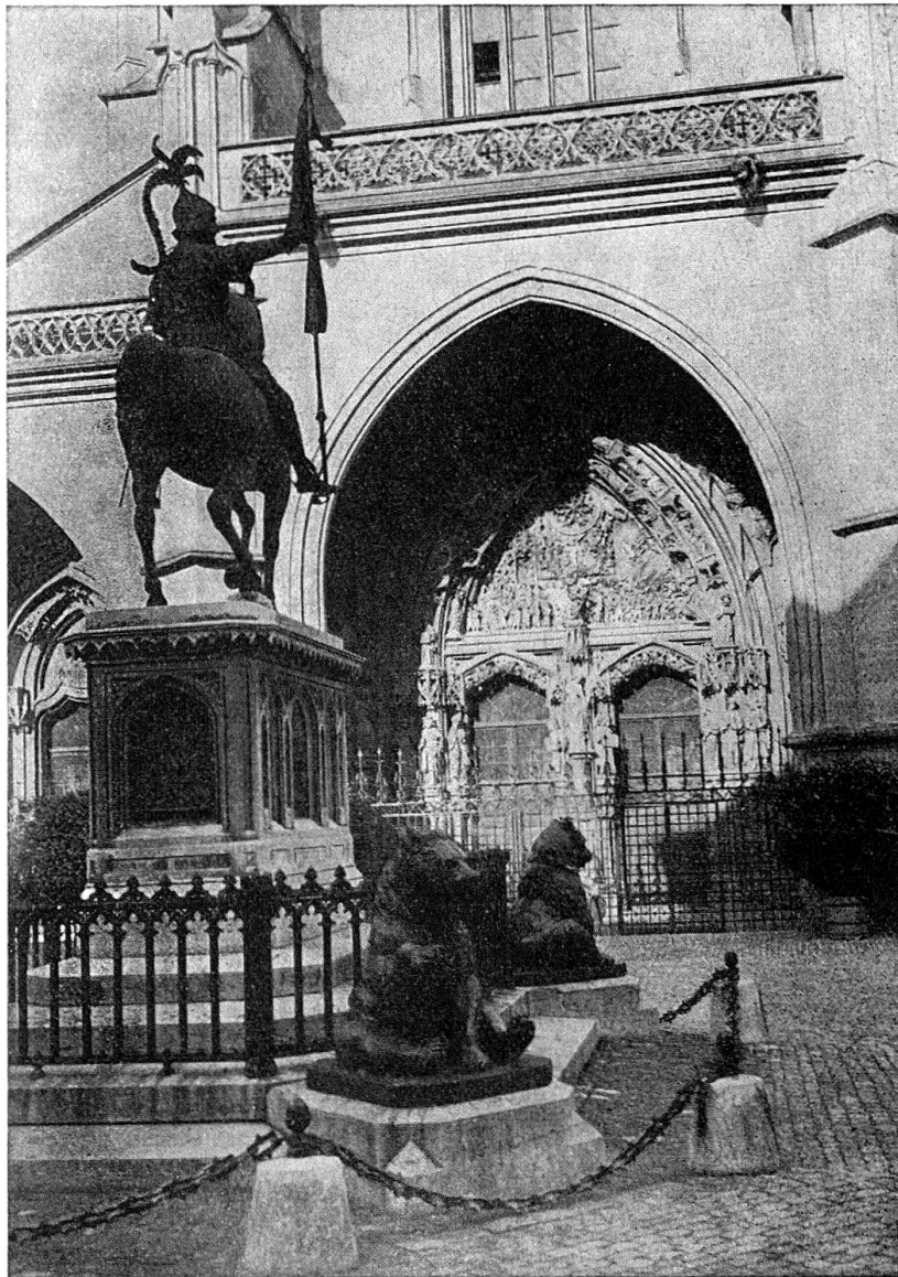
Auf dem Münsterplatz.

Wenn um die elfte Stunde hoch über uns die breit verströmenden Klänge der Mittagsglocke leise und leiser verklungen haben, werden Musikanten einsetzen, werden unsere Stimmen zum tiefsinnigen Lied ausholen, werden der Vorsitzende unseres Verbandes und ein hoher Offizier zu uns sprechen. — Und dann wollen wir in geordnetem Zug durch sorglich gewählte Strassen dieser Stadt ziehen, unsere eigenen Banner und die Feldzeichen befreundeter Verbände und Zünfte sollen im Winde wehen und unsere Herzen mit Stolz und gemeinsamen Gefühlen durchdringen. Der Zug wird sich hinaufbewegen zum Kursaal zu festlicher Tafel. Und hernach wollen wir uns allesamt an den Kameraden freuen, die aus berufener Hand die verdiente Auszeichnung für ihre Prüfungs- und Schiessergebnisse in Empfang zu nehmen haben.