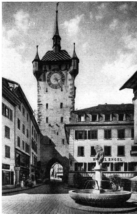
Stadttor in Baden (Aargau)

Diese Publikation gilt als Einladung, spezielle Auf- gebote erscheinen nicht mehr. Wir zählen auf lücken- losen Besuch. Die Sektionen, welche Fahnen besitzen, haben mit diesen zu erscheinen.