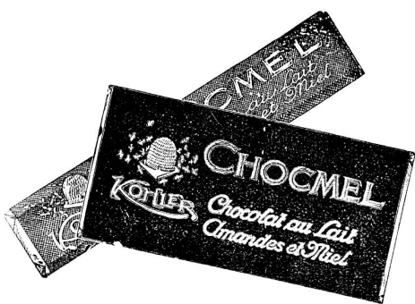
Ein nahrhafter Leckerbissen