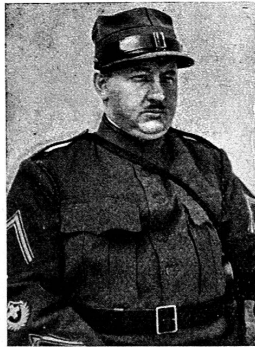
Adolf Tassera, Basel 1927—1930