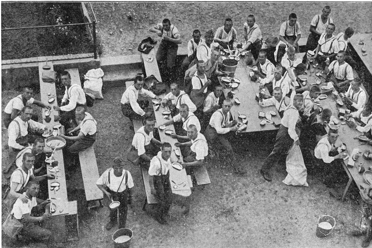
Ein erfreuliches Resultat von der Zusammenarbeit von Fourier und Küchenchef.

Bundesrat Decoppet bemühte sich als damaliger Vorsteher des Eidgen. Militärdepartements sehr für