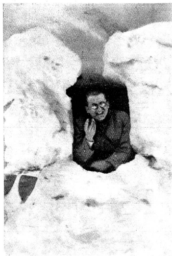
Unser Aktuar in Sicherheit.

Unsere Küchenmannschaft hatte schon am Nachmittag mit dem nötigen Proviant für die Teilnehmer und einer vollständigen Zugs-Kochausrüstung versehen, unter Leitung eines Quartiermeisters, die Hütte aufgesucht. Sie hatte dazu trotz schwerer Bepackung nur zehn Minuten mehr Zeit gebraucht, als die übrigen Patrouillen. Es zeigte sich, dass der Austausch der Lasten nach beispielsweise zehn Minuten Marschzeit weniger ermüdet, als die durchgehende Verteilung auf die einzelnen Personen. Bei Ankunft der übrigen Patrouillen war dann bereits eine schmackhafte Abendmahlzeit hergerichtet. Aber besonders am Sonntag Mittag bewies uns unser Freund Küchenchef, der noch die blaue Uniform trägt und auf etliche Jahre Aktivdienst zurückblicken kann, dass sich in den Militär-Kochkesseln auf offenem Feuer im Freien ein vorzüglicher Sonntagsbraten herrichten lässt, wie er aber