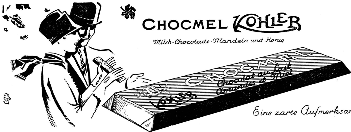
Eine zarte Aufmerksamkeit