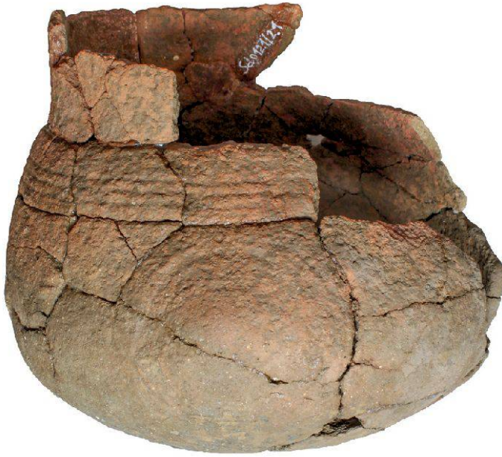
9 Schinznach-Dorf, Strick: Restauriertes Henkelgefäss mit Buckel- und Rillenverzierung aus einem der erfassten Gräber.

gedient haben. Bald verloren diese Strukturen an Bedeutung, wurden aufgegeben und zugeschüttet, um schliesslich in der zweiten Besiedlungsphase als Siedlungsfläche zu dienen. Baubefunde sind erst in der dritten Besiedlungsphase fassbar. Es handelt sich um eine Pfostenreihe und um plattige Unterlagsteine, die vermutlich zu einer Pfostenriegelkonstruktion gehört haben.