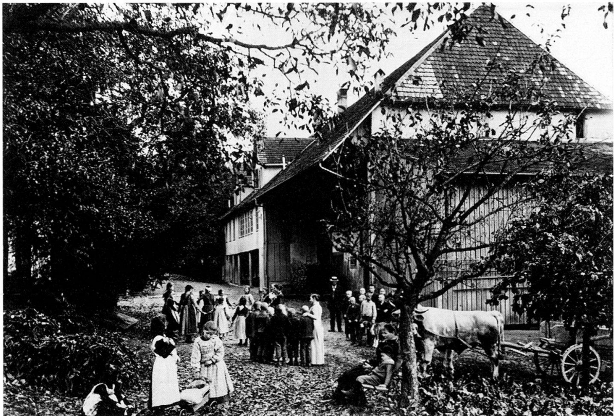
Die Taubstummenanstalt verlegte ihren Sitz erst 1877 auf den Landenhof. Erst bezog sie ein Gebäude in der Baumschule Rombach, anschliessend war sie für Jahrzehnte in Aarau untergebracht. Die Bilder zeigen den Standort in Aarau am Ziegelrain (1850–1853) und die Schule auf dem Landenhof (seit 1877).