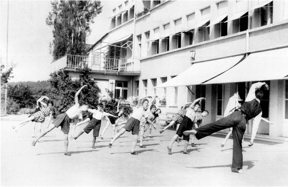
Körperliche Ertüchtigung vor dem Landenhof, Bild von 1924.

Sonderschulen, die Qualität des Unterrichts sowohl im Bereich der Infrastruktur wie auch des Personals zu steigern. Versagt hatte die Gesellschaft nicht zuletzt in der Eingliederung der Gehörlosen in den Arbeitsmarkt. Es wurde für die Taubstummenanstalten immer schwieriger, ihre Abgänger in KMU oder anderen Betrieben unterzubringen. Bis in die 1950er-Jahre fehlte ein Ausbildungsangebot, das auf die Bedürfnisse der Gehörlosen zugeschnitten war. Es ist bezeichnend, dass diese Lücke wiederum durch die Fachhilfeorganisationen geschlossen werden musste. Noch heute besteht diesbezüglich ein gewisses Manko. Indem die Berufsschule für Hörgeschädigte ihr Ausbildungsangebot von der Lehre auch auf die Berufsmatur ausdehnte, steht Hörbehinderten heute ein viel grösseres Spektrum an Berufen und Lehrausbildungsmöglichkeiten zur Verfügung. 34