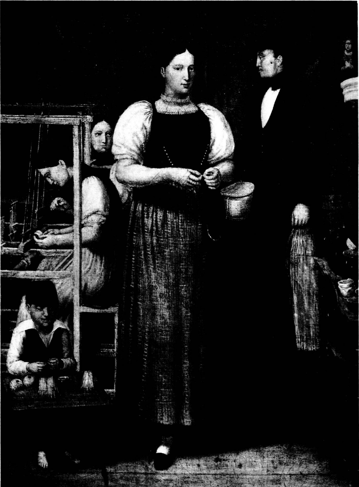
Freiämter Bauernstube mit Strohflechtereier. Anonym. Mitte 19. Jahrhundert