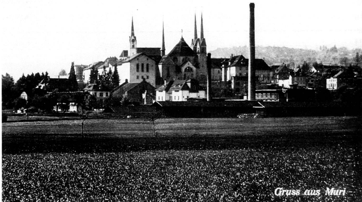
Ziegel- und Backsteinfabrik mit den beiden Hochkaminen. Heute als Lager verwendet