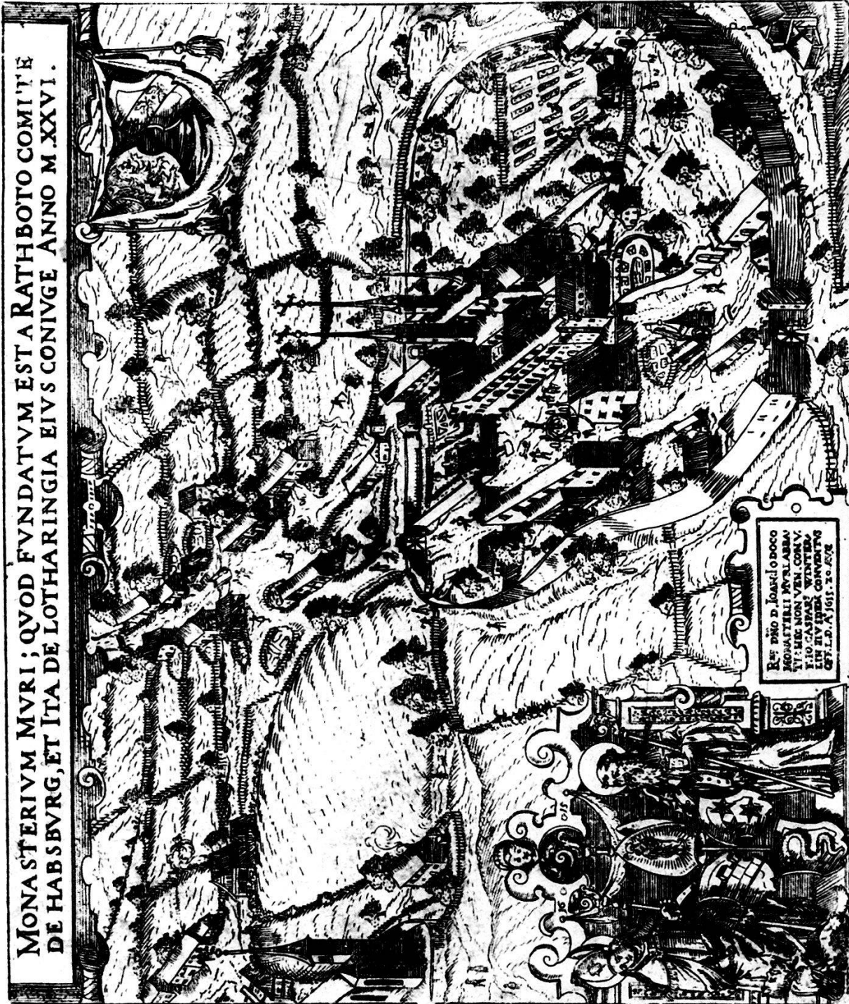
Abbildung 3 Ansicht des Klosters Muri von Südosten um 1615 von C. Winterlin