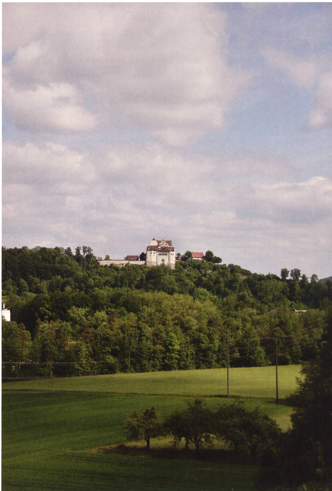
9 Möriken-Wildegg, Schloss Wildegg. Die mittelalterliche Burg hat sich im Lauf der Jahrhunderte zum herrschaftlichen Patriziersitz und zum Museum gewandelt und wurde vor ihrer Integration in das Museum Aargau umfassend renoviert.