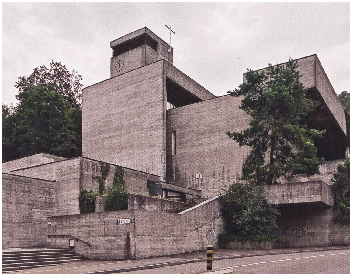
5 Ennetbaden, römisch-katholische Pfarrkirche St. Michael. Die 1963–1966 nach Plänen von Hermann und Hans Peter Baur errichtete ausdrucksstarke Sichtbetonkirche wurde 2016 unter kantonalen Schutz gestellt.