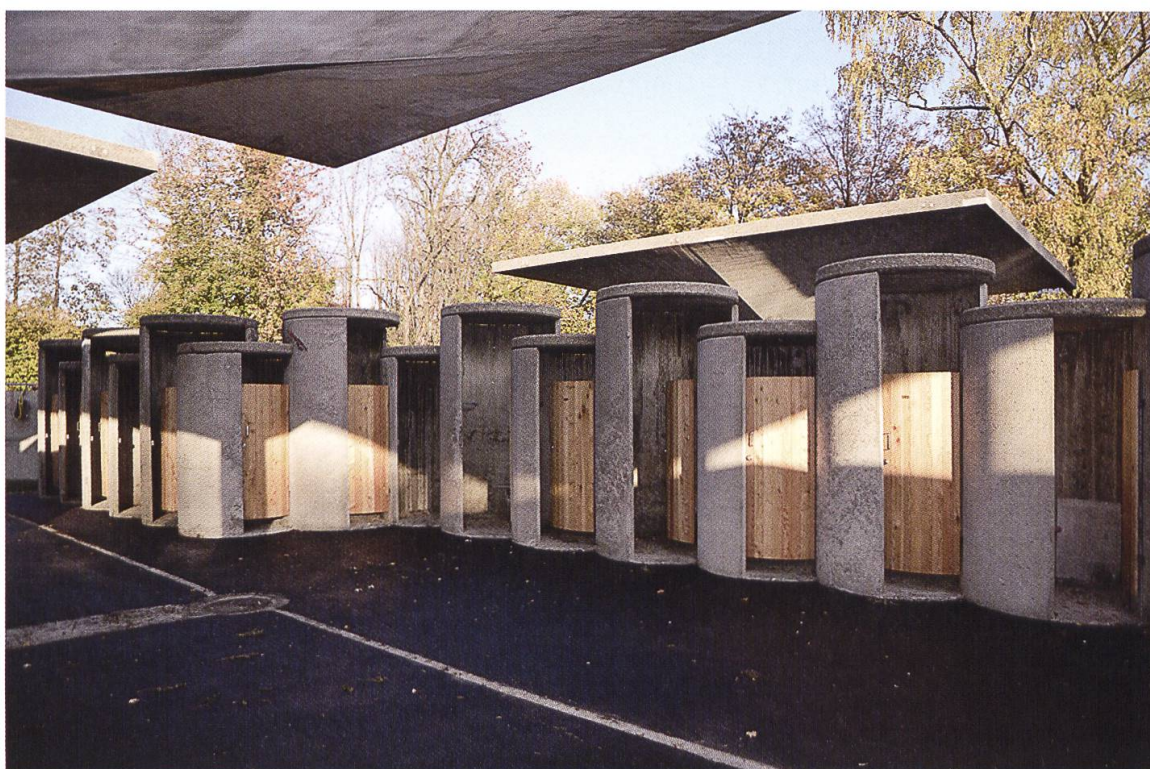
4 Wohlen, Freibad Bünzmatt. Das 1965/66 von Dolf Schnebli erbaute Freibad Bünzmatt in Wohlen, das unter anderem durch Pilzdächer und zylinderförmige Umkleidekabinen charakterisiert ist, steht seit 2017 unter kantonalem Schutz (Foto: © Kantonale Denkmalpflege Aargau, Isabel Haupt, 2018).