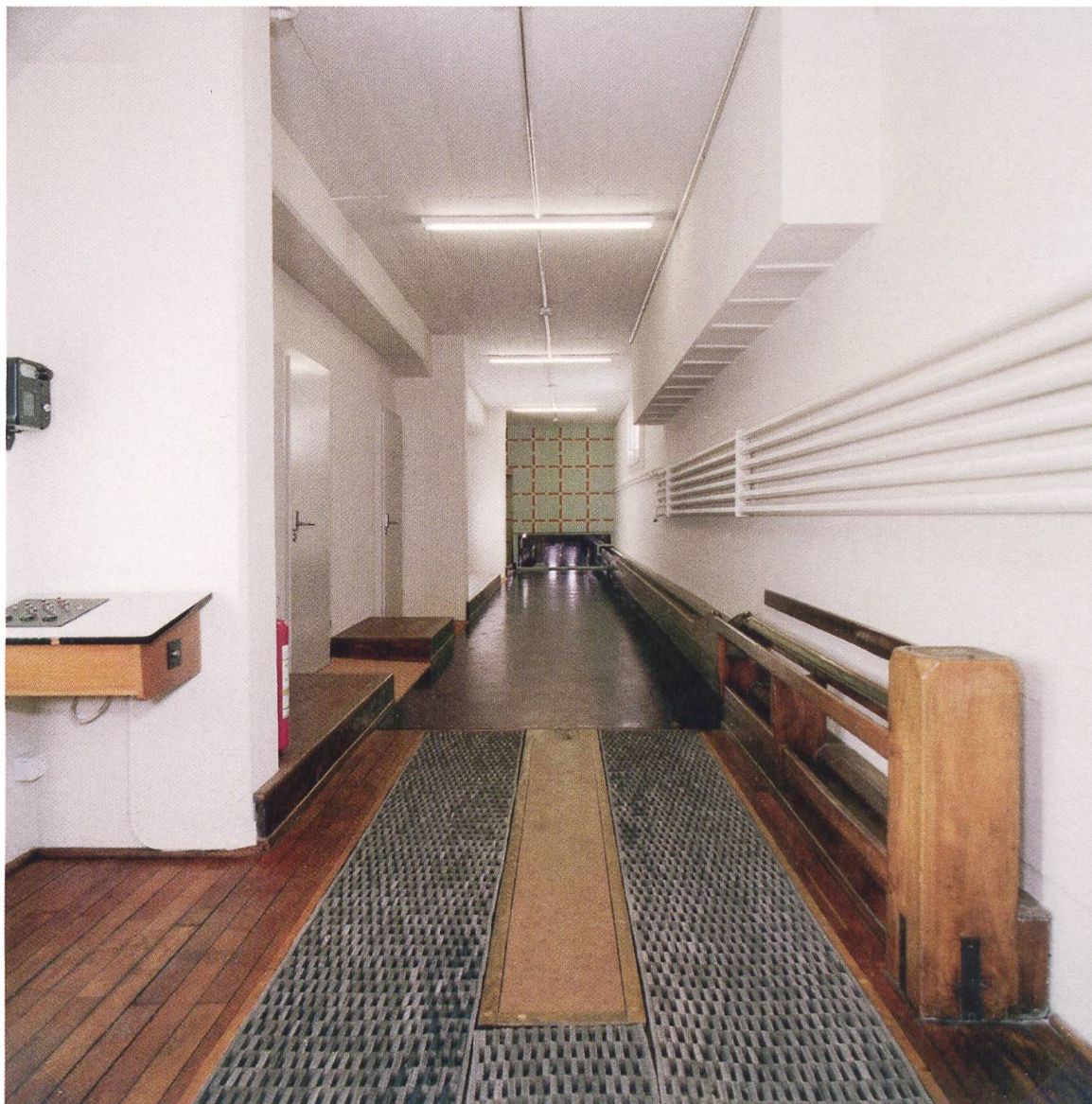
14 Möhlin, Bata-Kolonie, Clubhaus. Im 1948 nach Plänen von Hannibal Naef erbauten Clubhaus dient die ehemalige Kegelbahn heute als Erschliessung für neu eingebaute Hotelzimmer.