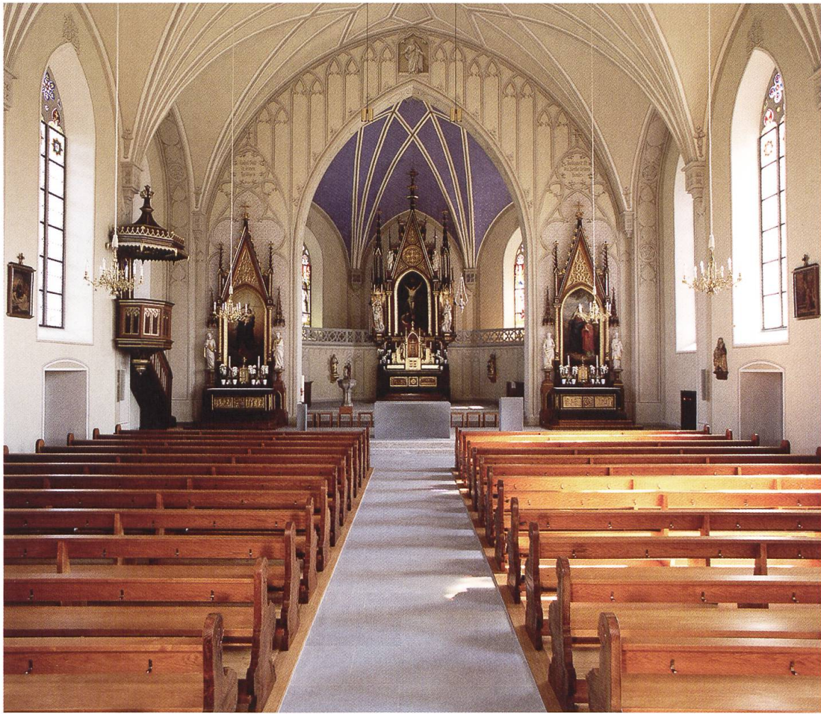
7 Bünzen, röm.-kath. Pfarrkirche St. Georg und Anna. Die 1862 geweihte Kirche von Caspar Joseph Jeuch wurde 2012–2014 im Inneren restauriert. Die bauzeitliche, 1933 übermalte Masswerkmalerei in Grisaille, wie sie am Triumphbogen zu sehen ist, wurde rekonstruiert.