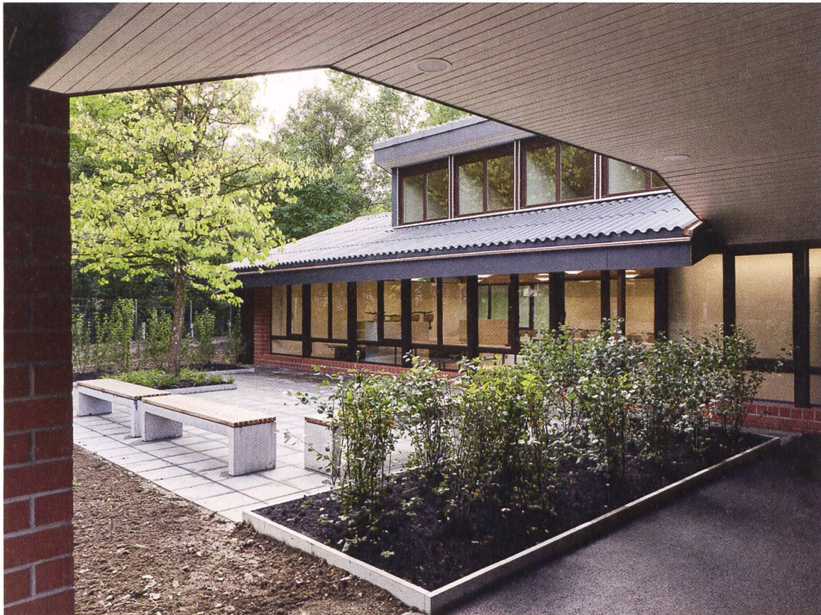
15 Möriken-Wildegg, Schulanlage Hellmatt, Innenhof. Die Anlage mit Klassenpavillons und zugeordneten Gartenhöfen wurde 1967–1978 vom Architekturbüro Metron gebaut, 2013 unter kantonalen Schutz gestellt und bis 2018 renoviert und ertüchtigt (Foto: © Kantonale Denkmalpflege Aargau, Goran Potkonjak, 2017).