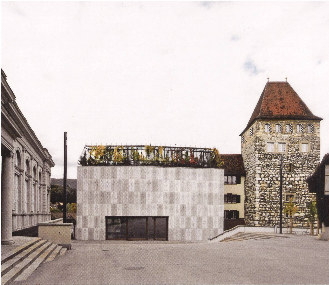
8 Aarau, Stadtmuseum Aarau. Die Räumlichkeiten des Museums erstrecken sich sowohl auf das «Schlössli», einen wehrhaften Turm aus dem 13. Jahrhundert, wie auf den 2015 fertiggestellten Erweiterungsbau der Architekten Diener&Diener und Martin Steinmann (Foto: © Kantonale Denkmalpflege Aargau, Christian Richters, 2015).