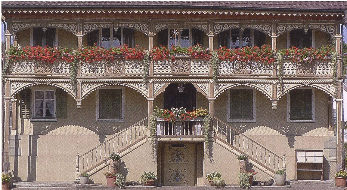
1 Dietwil, Vorderdorfstrasse 1. Das aus dem Jahr 1767 stammende stattliche «Freiämterhaus», das 1892 einen Laubenvorban in den Formen des Schweizer Holzstils erhielt, wird im 2013 aktualisierten Bauinventar der Gemeinde Dietwil gewürdigt.