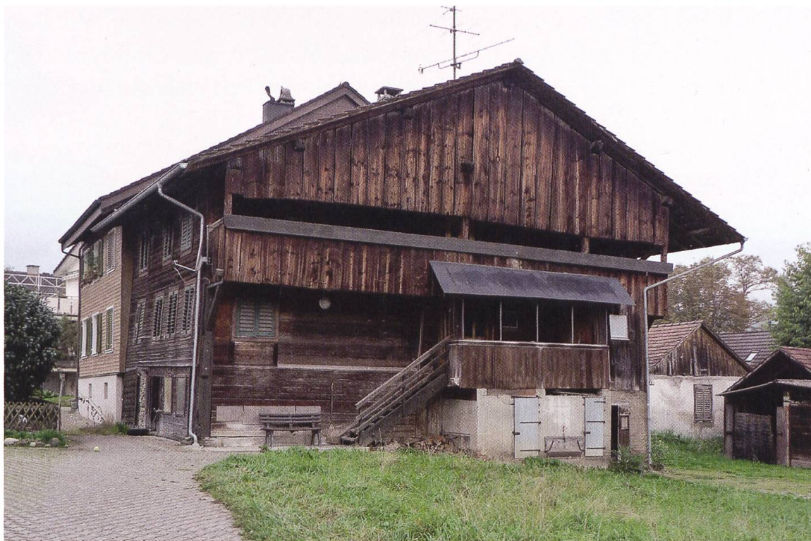
3 Auw, Wohnhaus an der Käsereistrasse 13. Das im frühen 18. Jahrhundert vergrösserte Tätschhaus mit einem dendrodatierten Kernbau von 1469/70 wurde 2019 integral unter kantonalen Schutz gestellt.