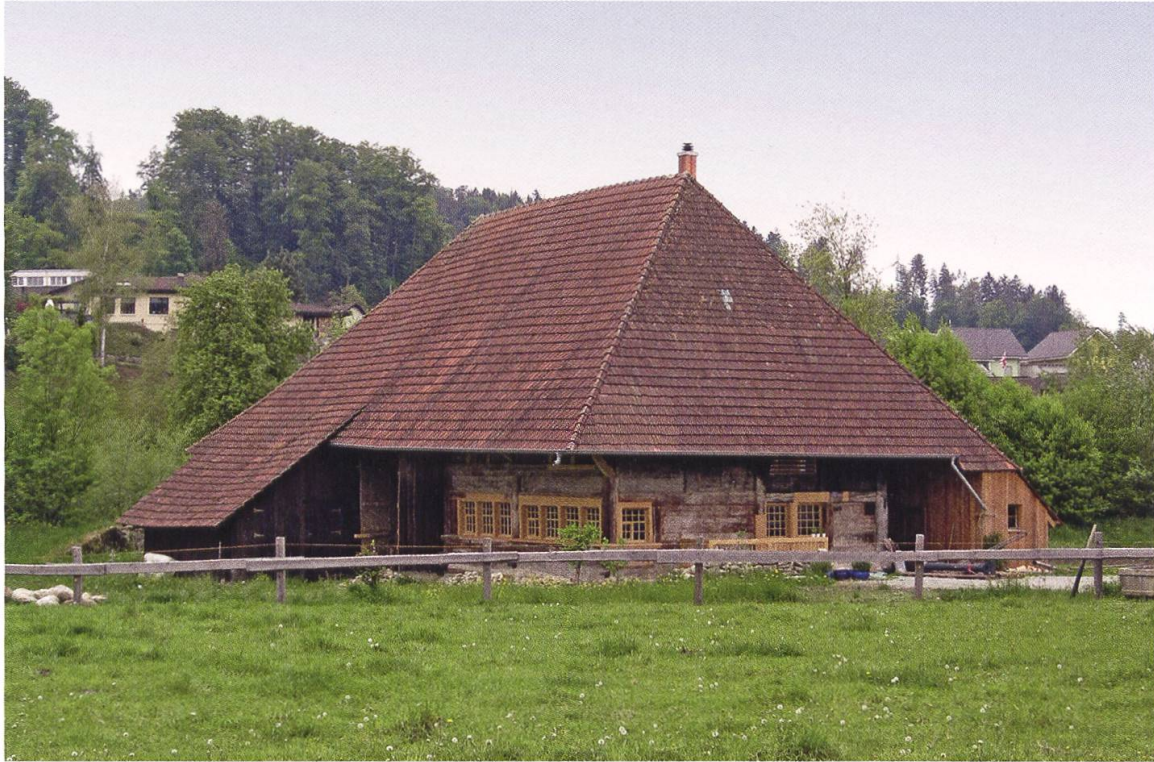
12 Staffelbach, Hochstudhaus am Mühleweg 22. Das vermutlich im 17. Jahrhundert erbaute, ehemals strohgedeckte Bauernhaus ist ein sehr gut erhaltener Bohlenständerbau und wurde 2018 restauriert (Foto: © Kantonale Denkmalpflege Aargau, David Wächli, 2018).