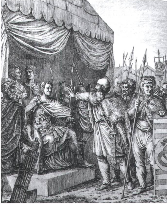
5 Schulers Neujahrsblätter werden jeweils von einem thematisch passenden Bild begleitet. Hier ein Stich von Franz Hegi, der den anfänglichen Widerstand der Helvetier gegenüber Julius Cäsar illustriert.