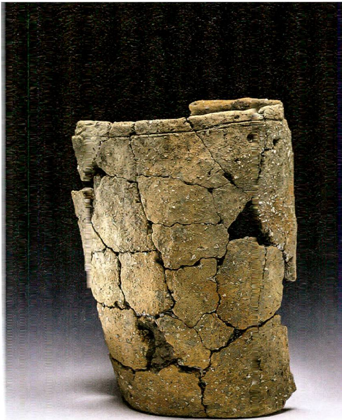
9 Eglistwil-Seengerstrasse. Rekonstruiertes Vorratsgefäss der Horgener Zeit aus der mutmasslichen Wohnsube.