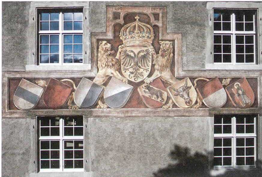
2 Wappenfresko der acht alten Orte auf der Fassade des Landvogteischlosses, 1492 aufgemalt.

derung des Königs, Herzog Friedrich IV. trotz dem drei Jahre zuvor geschlossenen Friedensvertrag angreifen zu dürfen, wurde nicht nur über den König selbst legitimiert, sondern auch als rechtmässig bezeichnet, weil sich der Herzog selbst gegen die rechtmässige und göttliche Ordnung gestellt habe. Dieses negativ gezeichnete Bild von Friedrich hat sich über Jahrhunderte hinweg gehalten. Die Eroberung selbst wird als knappe Ereignisgeschichte abgehandelt, der Prozess der Aneignung so gut wie gar nicht. Dies änderte sich bis ins 19. Jahrhundert nicht.