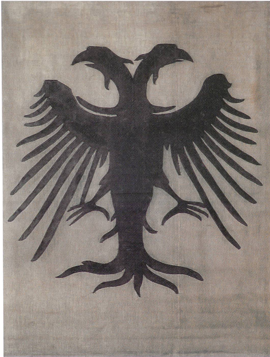
2 Reichsfahne aus Zofingen (Stadtmuseum Zofingen). Die eilig hergestellte Fahne könnte im Zusammenhang mit 1415 stehen. Ihre Verwendung ist nicht bekannt.