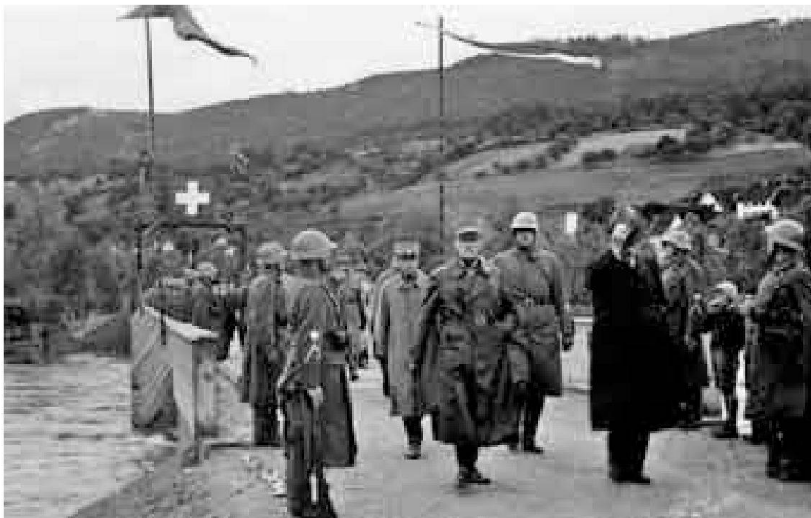
Besichtigung der neuen Brücke zwischen Biberstein und Rohr durch Prominenz aus Militär und Politik am Dienstag, 16. Juli 1940. (Widmer-Dean/Lüthi, Biberstein)

Rheinfelden weiter nordwestlich liegt und Biberstein deshalb wohl nicht als Etappenort für die dort Evakuierten infrage kam. Laufenburg besass 1941 1531 Einwohner. 46 Wenn von der Gesamtbevölkerung die Hälfte zurückgeblieben wäre, also die wehrhaften Männer und die Ordnungsmannschaften, hätte Biberstein trotzdem rund 750 Personen aufnehmen müssen, was die Bevölkerung Bibersteins, wenn auch nur für kurze Zeit, mehr als verdoppelt hätte. 47