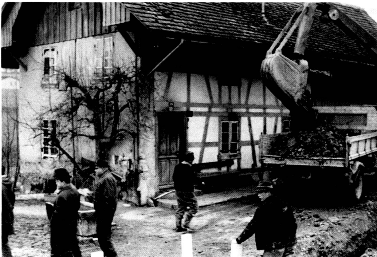
Bau der Wasserversorgung an der Hünikerstrasse, 1968.

Nach Abschluss der ersten Bauetappe drängte sich eine rasche Realisierung der zweiten Etappe auf, denn die Wasserverhältnisse in Oberschneisingen wurden immer prekärer. An der Gemeindeversammlung im Dezember 1971 gab ein Bürger zu bedenken, dass «nicht weniger als acht Haushaltungen von der grossen Wasserknappheit» betroffen seien und er deshalb den Gemeinderat auffordere, «die Angelegenheit so schnell wie nur möglich speditiv an die Hand zu nehmen.» 44 Mitte 1972 sprachen die Stimmbürger dem Kredit von 900 000 Franken für die zweite Ausbauetappe der Wasserversorgung Oberschneisingen zu. 45 Am 21. Juni 1975 konnte die über drei Millionen Franken teure Gemeindewasserversorgung mit einem Fest eingeweiht werden. 46