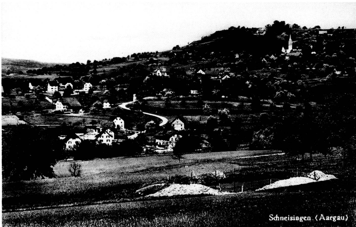
Blick auf Schneisingen, Mitte der 1940er-Jahre: im Vordergrund ein Weiher zur privaten Stromerzeugung.

anschaffungen machten dann auch nur der Einbau einer Zentralheizung ins neu renovierte Schulhaus, der Kauf einer moderneren Feuerwehrmotorspritze als Ersatz für die über hundertjährige Handspritze sowie die Anschaffung eines «Strassenabrandpflugs» aus. 7