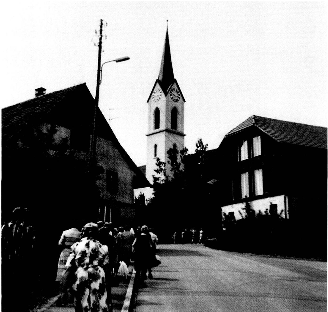
Rege benutztes Trottoir der ausgebauten Zelglistrasse, 1978.

werden: «Der Behörde sind die teilweise prekären Strassenverhältnisse in unserer Gemeinde bekannt. [Der Gemeinderat] gibt seiner Hoffnung Ausdruck, in absehbarer Zeit Verbesserungen vornehmen zu können.» 70 Ein zweiter hauptamtlicher Gemeindearbeiter wurde angestellt, vor allem aber ein systematischer Ausbau und die Asphaltierung der Nebenstrassen vorgenommen, was bis in die 1980er-Jahre andauerte. 71 Die Ausbaustrategie erfuhr jedoch gegen Ende der 1970er-Jahre eine Korrektur. So äusserte der Gemeinderat 1984 anlässlich einer Strassenerschliessung eines neuen Quartiers: «Heute ist man allgemein von der bisher eingehaltenen Strassenausbaueuphorie abgekommen. Man erstellt keine «Rennbahnen» mehr [...].» Vielmehr solle man den Verkehr zur Beruhigung zwingen, erklärte der Gemeinderat weiter. 72