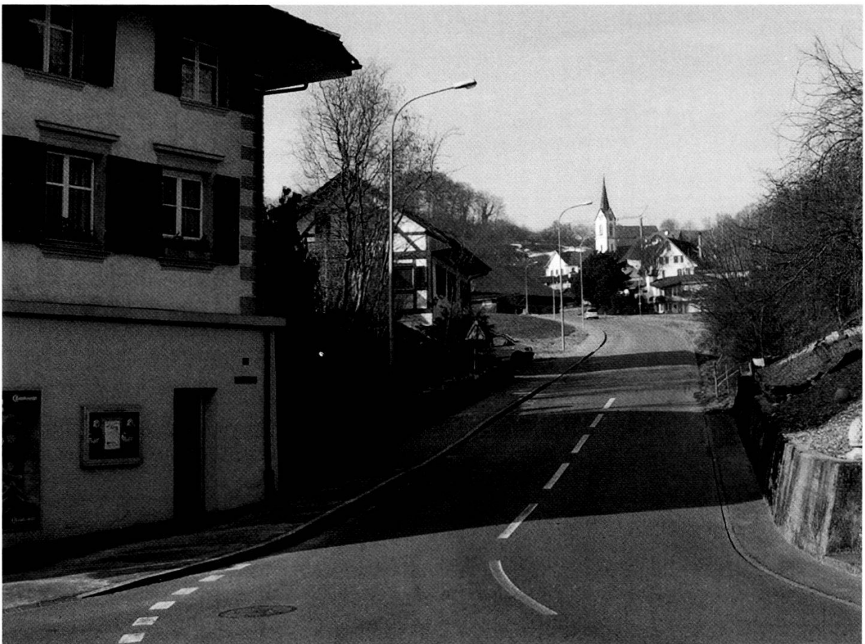
Zelglistrasse im Sommer 1961, kurz vor Ausbau und Teerung. Im Vergleich dazu die Situation im Jahr 2006. Gemeindearchiv Schneisingen, Fotosammlung, Privatsammlung Herbert Schwitter.