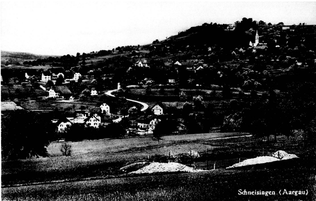
Blick auf Schneisingen, Mitte der 1940er-Jahre: im Vordergrund ein Weiher zur privaten Stromerzeugung.

anschaffungen machten dann auch nur der Einbau einer Zentralheizung ins neu renovierte Schulhaus, der Kauf einer moderneren Feuerwehrmotorspritze als Ersatz für die über hundertjährige Handspritze sowie die Anschaffung eines «Strassenabrandpflugs» aus. 7