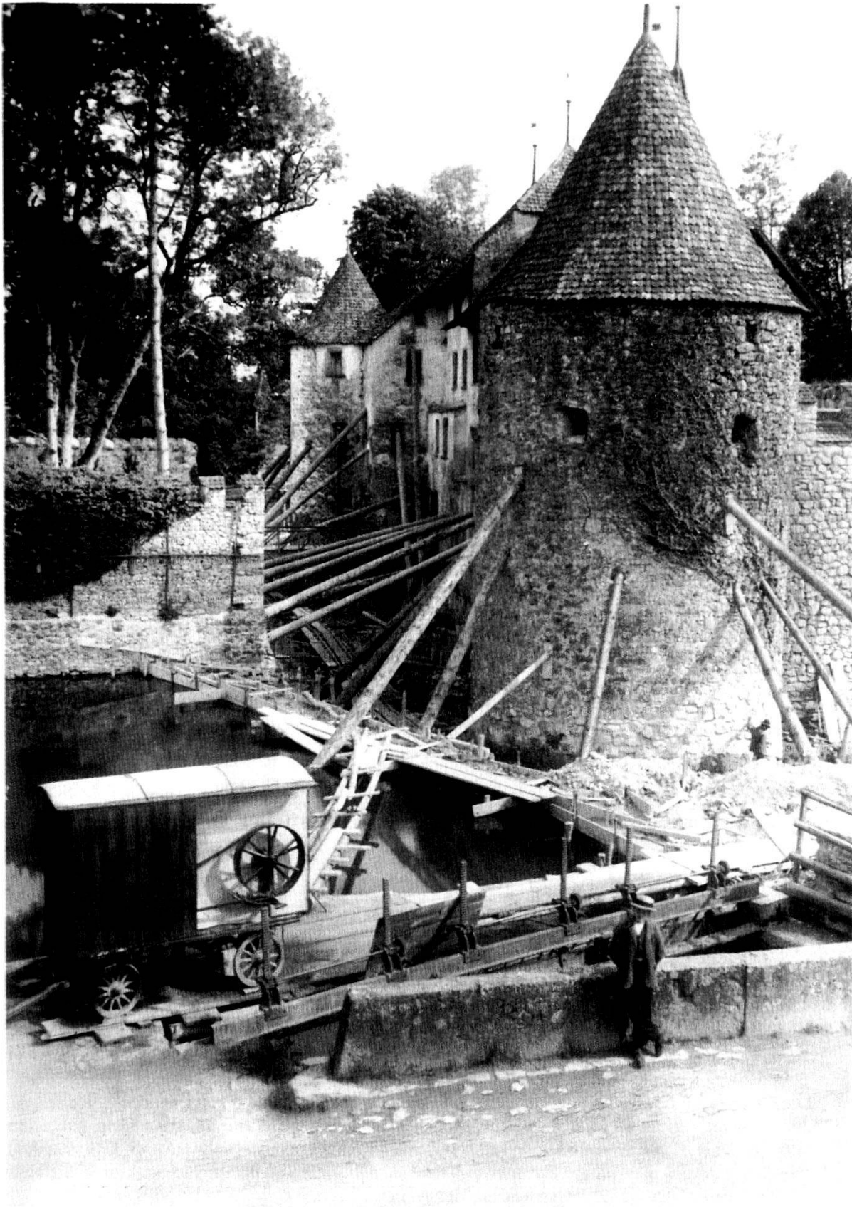
Abb. 18: Das hintere Schloss während der archäologischen Grabungen 1911.