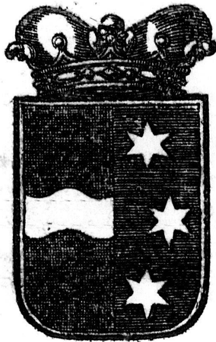
Abb. 8: Schulordnung 1805.

Das erste aargauische Schulgesetz, die «Schulordnung» des Jahres 1805, verpflichtete jede Gemeinde zur Führung einer Schule, legte Schulpflicht für alle fest und bildet damit das Fundament der Aargauer Schule – bis heute.