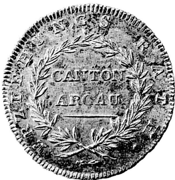
Abb. 5: Schulprämien des helvetischen Erziehungsrates.

In der philanthropischen Erziehungslehre hatte die formelle Belohnung einen hohen Stellenwert. Der helvetische Bildungsminister Stapfer hielt die Erziehungsräte an, das Mittel der Prämien zur Verbesserung des Schulwesens intensiv einzusetzen.