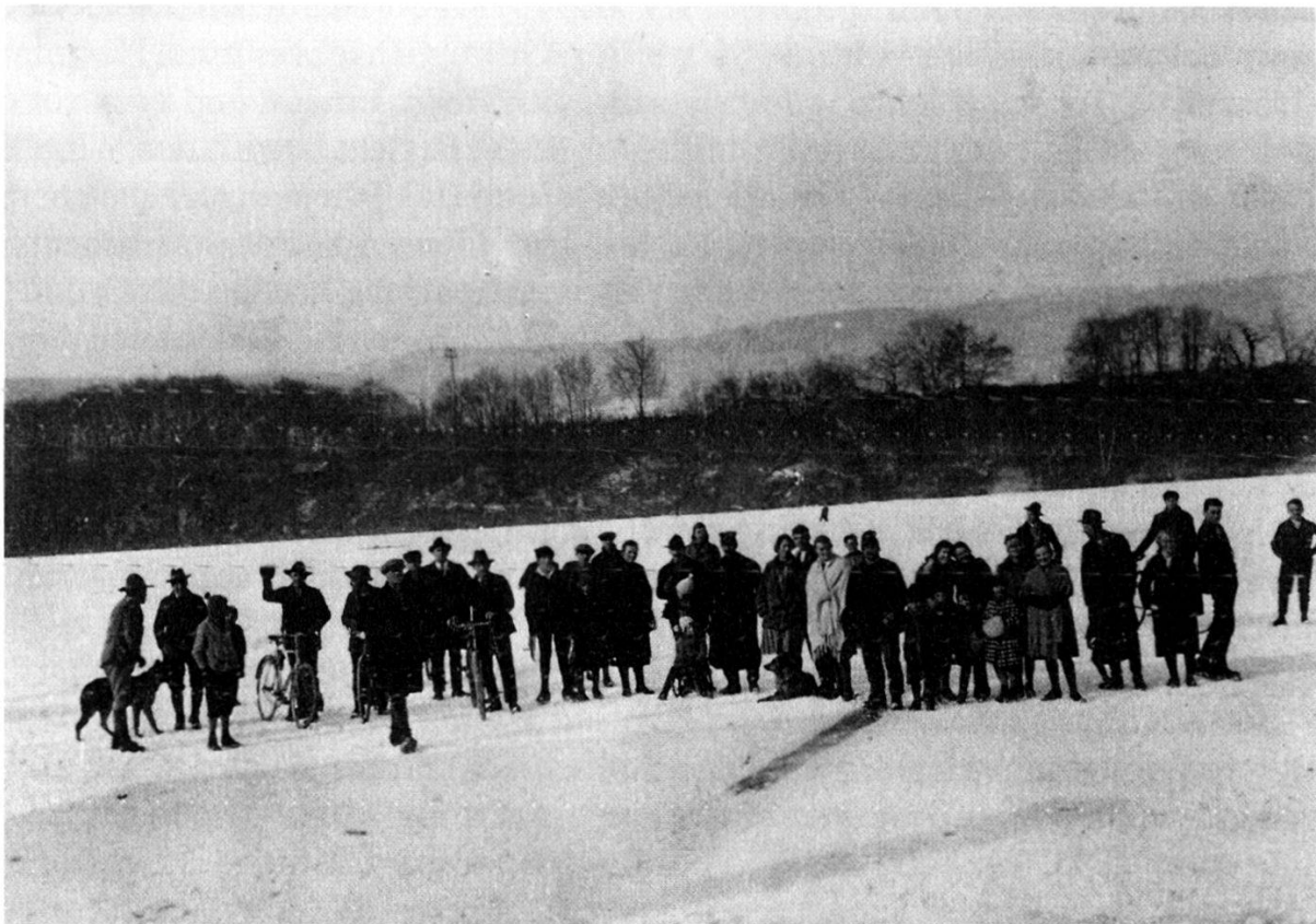
Abb. 9: Fröhliches Volk auf dem überfrorenen Rhein.